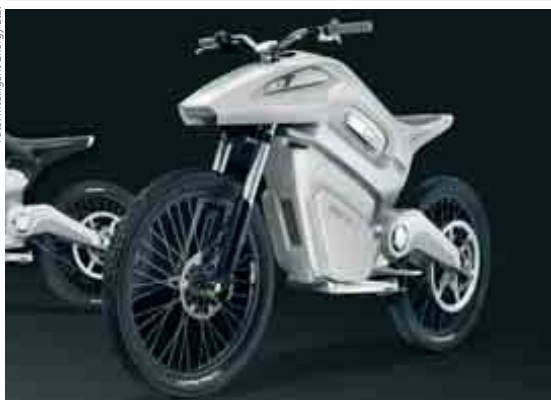
El ciclomotor ENV: silencioso y discreto