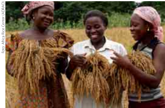
Las agricultoras de Benin han visto aumentar sus ingresos con el cultivo de Nerica .

comenzó el laborioso proceso de selección de líneas parentales para obtener la mejor combinación de caracteres, cruzando los parentales para obtener descendientes híbridos y a continuación cruzando esos descendientes con la línea parental O. sativa a fin de fijar los rasgos deseados. Tras una serie de