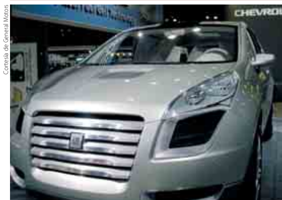
Cortés de General Motors

Se estima que el Sequel de GM saldrá al mercado en 2012. Con su aceleración a 100km/h en menos de 10 segundos, es mucho más rápido que la actual media de los automóviles a pila de combustible.