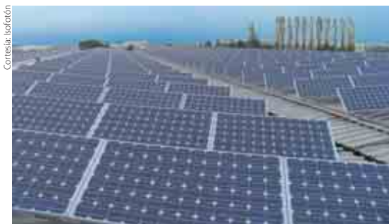
La instalación de un sistema fotovoltaico en el tejado de la fábrica de queso Torelli Pierluigi en Parma (Italia) ha hecho posible reducir los costos.

Aunque Isofotón nunca cede sus derechos de PI. a terceros, en ocasiones concede licencias respecto de las tecnologías de fabricación del módulo. La empresa normalmente recurre a esa opción en los mercados estratégicos que poseen un nivel de prioridad secundario para sus actividades, con el objetivo de establecer una asociación sólida con el licenciatario local y de ese modo obtener una presencia dinámica en el país. La transferencia de tecnología también está ligada a las ventas de células solares de Isofotón, el principal producto de la empresa.