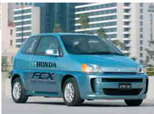
Honda muestra el prototipo de su FCX, automóvil eléctrico de última generación a pila de combustible, totalmente funcional. Honda ha presentado al PCT más de 40 solicitudes de patente relacionadas con pilas de combustible.

unidades domésticas diseñadas junto a la empresa de pilas de combustible estadounidense Plug Power Inc. Por su lado GM, cuyo Vicepresidente, Bob Lutz, estima que las pilas de combustible podrían crear una nueva edad de oro para la empresa, prevé lanzar al mercado en 2011 un modelo doméstico, que produciría hidrógeno a partir de electricidad o de luz solar. En 2007, GM se propuso lanzar 100 todoterrenos Chevrolet Equinox a pila de hidrógeno para que los consumidores los prueben.