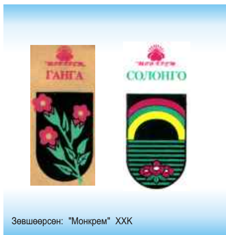
Зөвшөөрсөн: "Монкрем" ХХК

Компани бүр өөр өөрийн хэтийн бодлоготой байдаг. Таны сонголт ямар ч байсан та аливаа бараа үйлчилгээндээ ашиглаж байгаа, ашиглах гэж байгаа барааны тэмдгүүдээ бүртгүүлсэн байх ёстой.