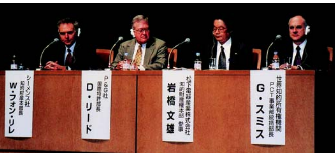
Mesa redonda en el seminario

El uso del PCT en el Japón ha sido objeto de un auge considerable en los últimos años y los solicitantes japoneses se sitúan hoy en tercer lugar de la lista de usuarios del PCT. ◆