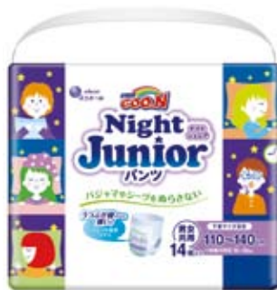
国際登録番号DM/204757および該当商品パッケージデザイン