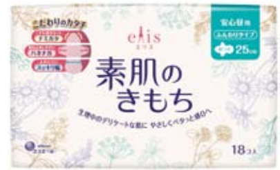
国際登録番号DM/208477および該当商品パッケージデザイン

出願しました。さらにハーグ未加盟のロシア周辺国や中国等へはパリルートで出願しています。