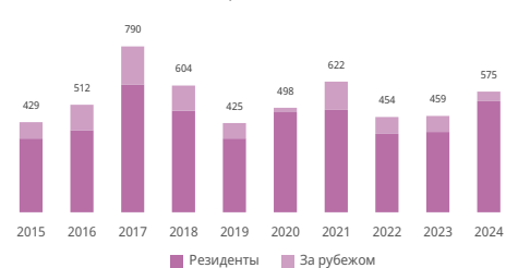
Число образцов в заявках