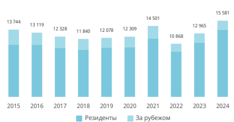
Число классов товарных знаков в заявках