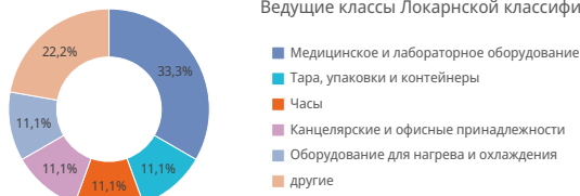
Ведущие классы Локарнской классификации; доля