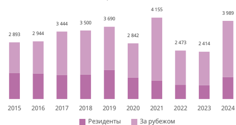
Число образцов в заявках