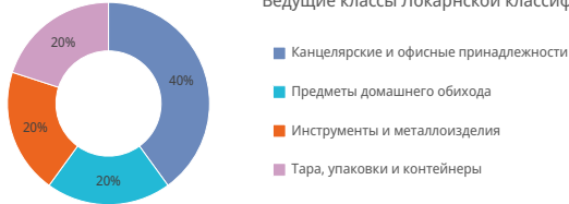
Ведущие классы Локарнской классификации; доля