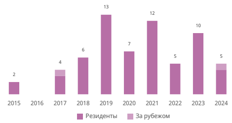
Число образцов в заявках