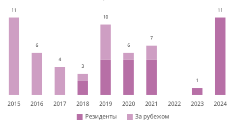
Число образцов в заявках

Ведущие классы Локарнской классификации; доля