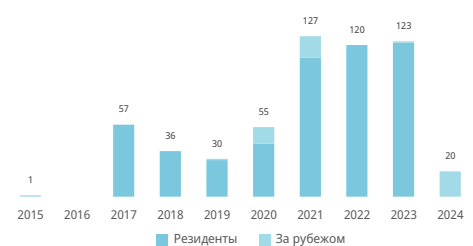
Число классов товарных знаков в заявках *

Ведущие классы Ниццкой классификации; доля