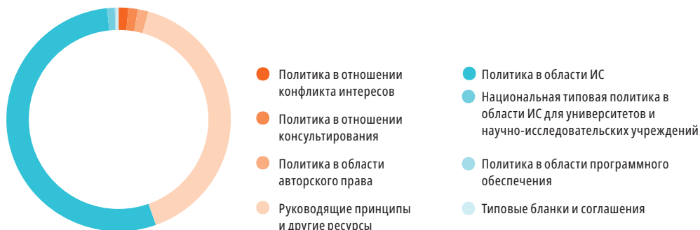
Рисунок 20. Коллекция документов в базе данных ВОИС по политике в области ИС