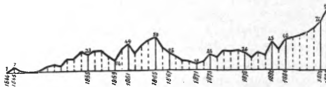
Fig. 5. — Photographie.

Si nous considérons les brevets relatifs à la photographie , on voit d'après la courbe ci-jointe (fig. 5) que leur nombre continue de s'accroître, malgré quelques