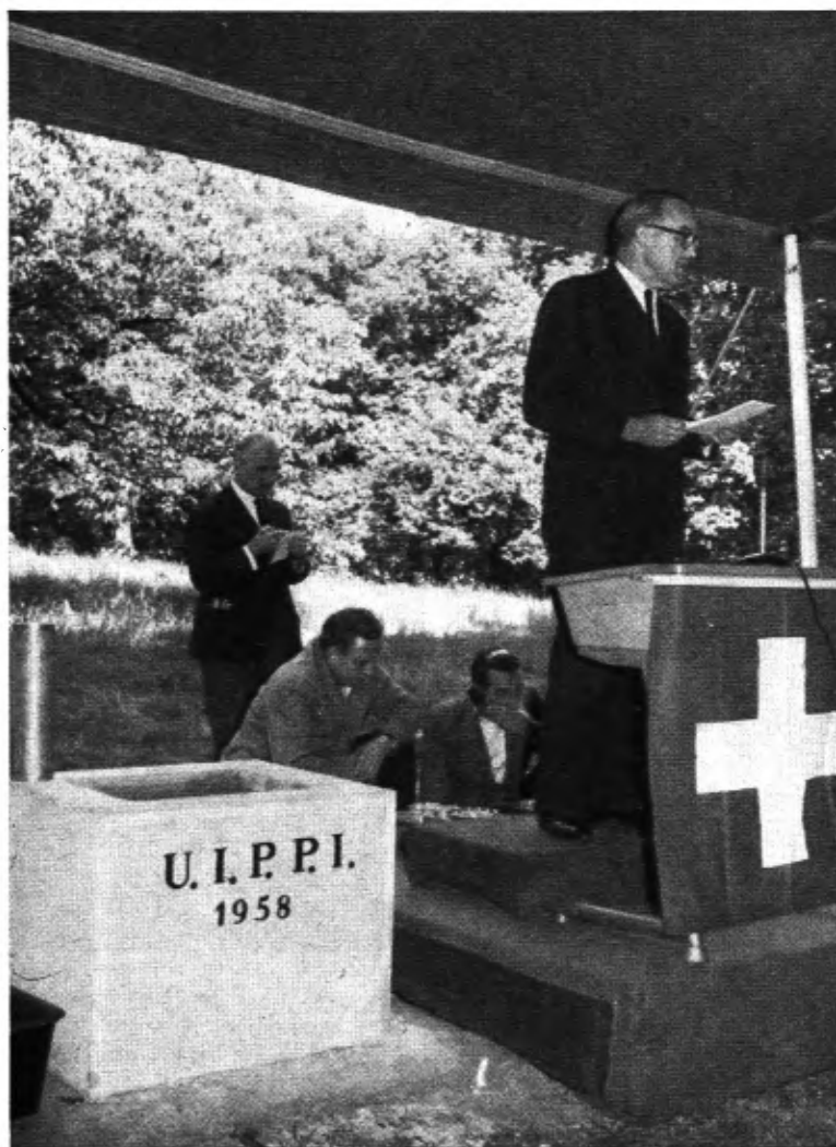
Monsieur Max Petitpierre , Conseiller fédéral, Chef du Département politique fédéral, à la tribune. On remarque à gauche de la photo, au premier plan, la première pierre du bâtiment, évidée, et le tube de plomb contenant les documents, prêt à y être déposé et scellé. Derrière l'orateur, debout, le reporter de Radio-Genève, et, au pied de l'estrade, deux techniciens surveillant les installations d'enregistrement radiophonique

Ces deux conventions et les Unions internationales qu'elles ont créées, ont résisté à l'usure du temps. Elles ont rendu les services qu'on attendait d'elles en assurant et en contribuant à améliorer la protection juridique et la sécurité du droit en faveur des inventeurs, des industriels, des commerçants, des