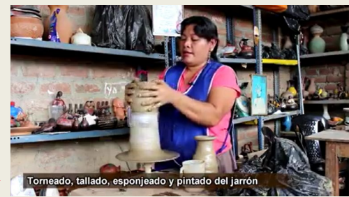
Torneado, tallado, esponjeado y pintado del jarrón