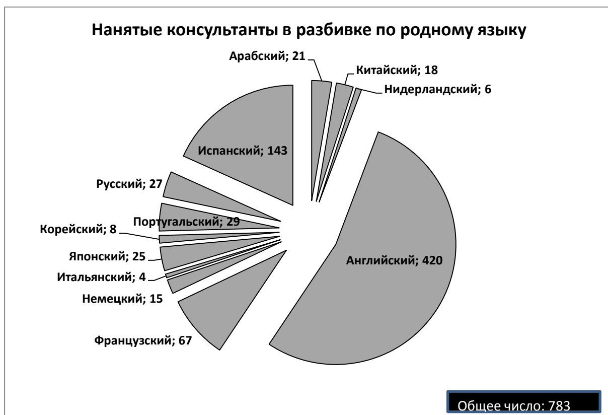
Таблица: нанятые консультанты в разбивке по родному языку