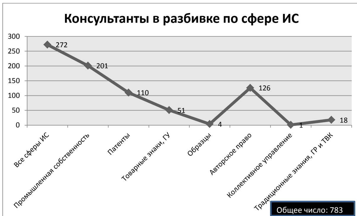
Таблица: нанятые консультанты в разбивке по сфере ИС, в которой они специализируются