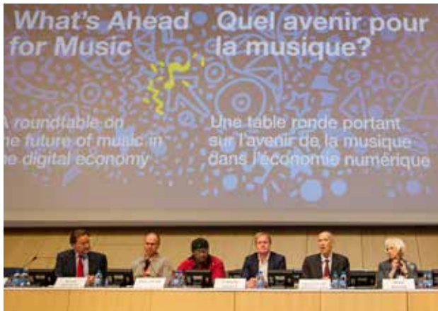
Avec d'autres acteurs de l'ensemble du secteur de la musique, Didier Awadi a participé à une discussion animée sur l'avenir de la musique. La table ronde a été organisée dans le cadre de la Journée mondiale de la propriété intellectuelle au siège de l'OMPI à Genève.

ce sont les interprétations en direct. C'est là que l'on peut se montrer véritablement créatif et faire quelque chose d'original qui peut avoir un retentissement mondial.