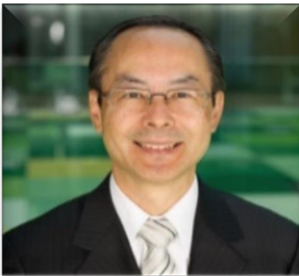
Sr. Yoshiyuki Takagi Subdirector general de la OMPI encargado del Sector de la Infraestructura Mundial

El Sr. Takagi dirige el Sector de la Infraestructura Mundial de la OMPI. El Sector facilita el intercambio de conocimientos sobre PI fomentando infraestructuras sostenibles de conocimientos, bases de datos gratuitas sobre PI y plataformas comunes que conectan a las oficinas de PI. Su labor se centra en: