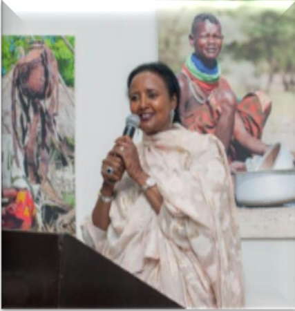
S.E. Sra. Amina C. Mohamed Ministra de Deportes, Cultura y Patrimonio de Kenya

La Sra. Amina Mohamed es una renombrada diplomática, abogada y negociadora de Kenya, de destacado desempeño en el servicio público de Kenya durante más de 30 años. En la actualidad es ministra de Deporte, Cultura y Patrimonio y ha trabajado anteriormente como ministra de Educación (2018-2019) y ministra de Relaciones Exteriores (2013-2018). También es copresidenta, junto con el ministro de Relaciones Exteriores del Reino Unido, de la Plataforma del Commonwealth para la Educación de las Niñas, una iniciativa encaminada a dar oportunidades de educación a 130 millones de niños del Commonwealth sin escolarizar.