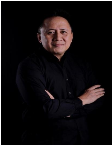
S.E. Sr. Triawan Munaf Presidente del Organismo Nacional de Economía Creativa de Indonesia

El Sr. Triawan Munaf es presidente del Organismo Nacional de Economía Creativa, organismo ministerial creado en 2015 con el mandato de coordinar las políticas de desarrollo de los sectores de la economía creativa en Indonesia. Antes de su nombramiento como presidente de dicho Organismo, fue presidente y asesor creativo (de 1999 a 2010) de AdWork, una agencia de publicidad propiedad, en parte, de EURO RSCG Worldwide . Desempeñó hasta 1999 el cargo de presidente/director ejecutivo/director ejecutivo creativo de AdWork desde su fundación en 1989, siendo asimismo uno de sus cofundadores.