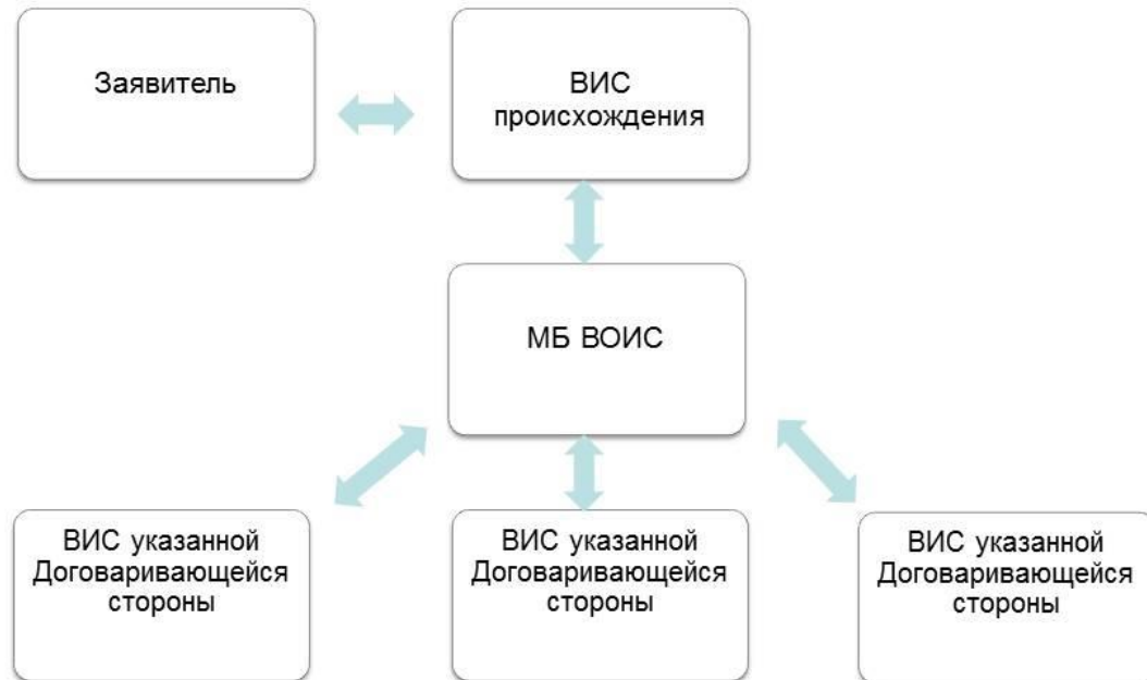
Диаграмма 4: Процесс международной регистрации товарного знака по Мадридской системе

WIPO WORLD INTELLECTUAL PROPERTY ORGANIZATION