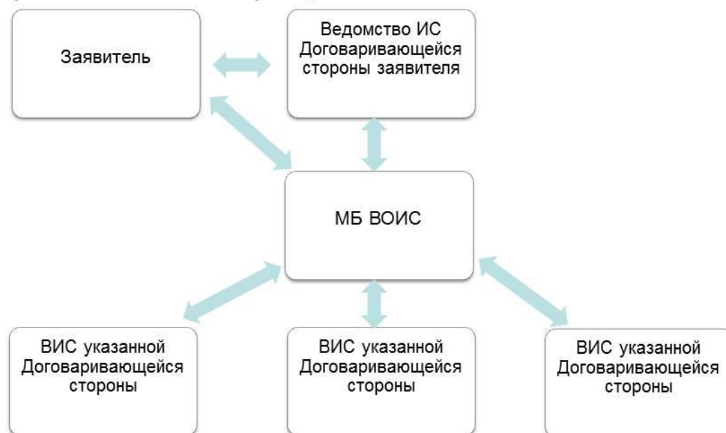
Диаграмма 5: Процесс международной регистрации промышленного образца по Гаагской системе

89. ВОИС занимается созданием новой ИКТ-платформы для Гаагской системы в целях поддержки модернизации и оптимизации всех внутренних и внешних организационных функций для повышения качества работы. В принципе, все стратегические элементы, обсуждавшиеся в контексте РСТ и Мадридской системы, актуальны и в контексте разработки этой новой системы.