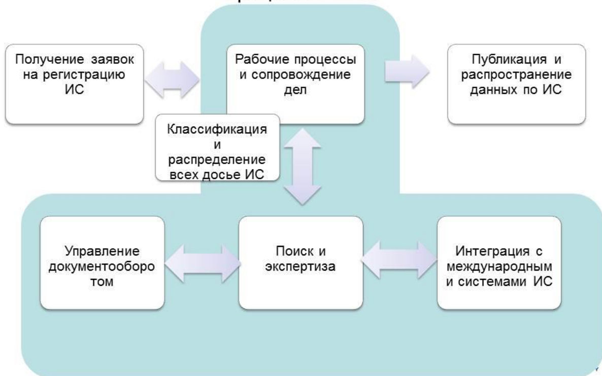
Диаграмма 1: Упрощенная схема организационных процессов ВИС

6. Диаграмма 1 содержит общую схему, на которой показаны задачи, организационные функции и рабочие процессы в сфере обработки заявок на регистрацию ИС в типичном ВИС.