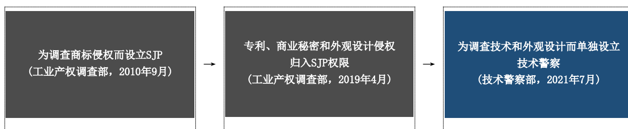
图 1: 技术警察时间线

3. KIPO 认识到需要通过提升其专业知识和克服因单一部门发挥多种作用而导致的低效，来更好地应对与技术有关的工业产权侵权行为。因此，在 2021 年，工业产权调查部经过重组，增加了人员数量，使商标警察处变为商标警察部，并单独设立技术和外观设计警察部（技术警察），以加强与专利技术和外观设计侵权以及未经授权披露商业秘密有关的执法活动。