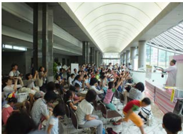
На презентации научного шоу.