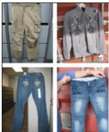
Foto: Servicio de Inmigración y Control de Aduana de los Estados Unidos. Ejemplos de las prendas de vestir que se introducen ilegalmente en el país a través de una zona franca en la zona de Los Ángeles. 12

10. Las actividades que se realizan en las zonas francas, que incluyen el ensamblaje, la fabricación, la transformación, el almacenamiento, el reenvasado, reetiquetado, almacenamiento y posterior envío son susceptibles de ser utilizadas por falsificadores para fabricar sus productos ilegales. Dadas las ventajas que se ofrecen en las zonas francas, los falsificadores pueden transbordar sus mercancías ilegales como si fueran legítimas. 10 El país de origen y el país de destino de las mercancías falsificadas pueden disimularse al transitar estas a través de múltiples puertos y zonas francas. 11