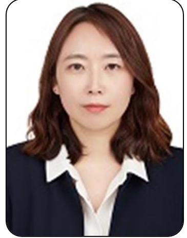
الكورية، وتجد اللغة الإنجليزية.