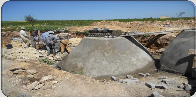
Des Digesteurs anaérobie