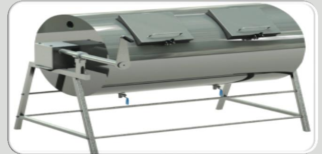
Composteur Manuel à Domicile