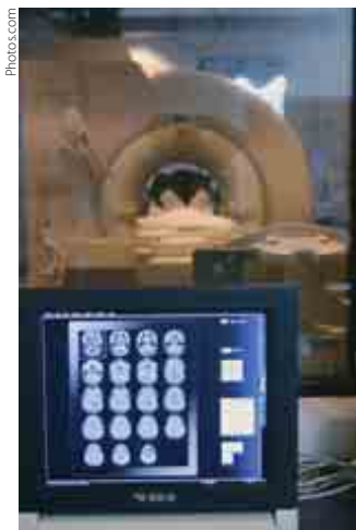
Los tomógrafos por emisión de positrones son el producto de una de las muchas tecnologías derivadas de los experimentos del CERN.

Las tecnologías derivadas de los experimentos del CERN han revolucionado la imaginología. Por ejemplo, la tecnología desarrollada en 1977 a partir de un prototipo creado por dos científicos del CERN, que combina la tomografía computarizada (TC), utilizada para obtener imágenes de la estructura y anatomía del cuerpo humano, con la tomografía por emisión de positrones (TEP), dirigida a funciones bioquímicas y metabólicas, permite hoy en día a los médicos contar con imágenes prácticamente perfectas para diagnosticar el cáncer y planificar su tratamiento.