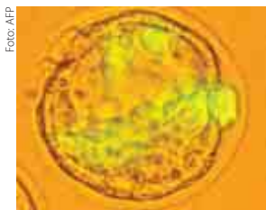
Célula madre embrionaria humana iluminada mediante la proteína verde fluorescente.

Este año, el premio Nobel de Química ha sido otorgado a Osamu Shimomura, Martin Chalfie y Roger Tsien por sus investigaciones sobre las irradiaciones verdes de una medusa, que han dado lugar al aislamiento y uso de la proteína verde fluorescente (GFP, por sus siglas en inglés), una de las herramientas más importantes para la investigación biocientífica contemporánea.