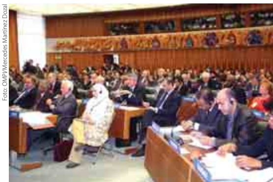
Las Asambleas de la OMPI congregaron a los 184 Estados miembros de la Organización.

La Secretaría preparó un estudio, a raíz de una solicitud cursada por la Asamblea del PCT en 2007, sobre los criterios aplicables para determinar el grupo de países en desarrollo y países menos adelantados cuyos solicitantes podrían beneficiarse de una reducción de las tasas del PCT, estudio en el que se apunta a que deberían aplicarse varios criterios, basados en los ingresos y otros indicadores económicos de desarrollo, y criterios basados en la dimensión de los países, en función de las respectivas economías (véase ( www.wipo.int/edocs/mdocs/govbody/en/pct_a_38/pct_a_38_5.doc )). Los Estados miembros convinieron en que dicha cuestión debe figurar en el orden del día de 2009 del Grupo de Trabajo del PCT.