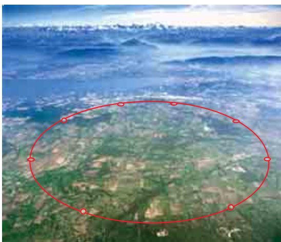
El LHC cruza la frontera entre Francia y Suiza a unos 100 metros bajo tierra.

Un gélido anillo de 27 kilómetros de longitud sumergido bajo tierra, más frío que el espacio exterior, donde las colisiones provocadas producen temperaturas mil veces superiores a la del sol, en un vacío donde la presión es diez veces inferior a la de la luna... no es de extrañar que el Gran Colisionador de Hadrones (LHC, por sus siglas en inglés) del CERN haya hecho volar la imaginación del mundo. Miles de científicos e ingenieros de más de 60 países han trabajado durante más de 20 años para crear una máquina de una maestría científica y complejidad técnica sin igual que ahondará en nuestros orígenes, en la búsqueda de las partículas infinitesimales que constituyen los componentes básicos del universo.