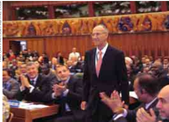
La Asamblea General designó al Sr. Francis Gurry Director General por aclamación el 22 de septiembre.

La serie de reuniones de las Asambleas de los Estados miembros de la Organización Mundial de la Propiedad Intelectual (OMPI), celebrada en septiembre con objeto de examinar las actividades realizadas en el último año y debatir el programa de trabajo futuro de la Organización, alcanzó su punto culminante con el nombramiento del Sr. Francis Gurry al cargo de Director General de la