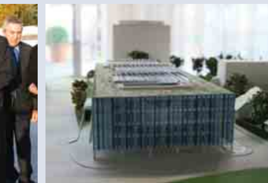
El nuevo edificio de la OMPI será uno de los primeros en Ginebra que incorpore una fuente de energía sostenible: un sistema de refrigeración que utiliza agua del lago Léman.

El nuevo edificio contará con cuatro plantas subterráneas, una planta baja de tipo atrio con una cafetería y cinco plantas de oficinas con 560 lugares de trabajo. El edificio, diseñado por la firma alemana Behnisch Architekten , incorpora un sistema de refrigeración que utiliza agua de las profundidades del lago de Ginebra, y sus 1400 m 2 de cubierta se aislarán