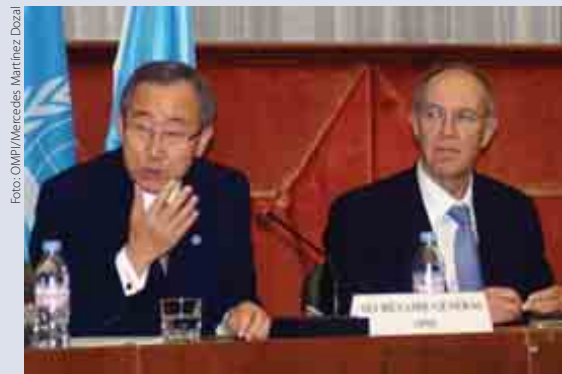
El Secretario General de las Naciones Unidas, Sr. Ban Ki-Moon, se dirige al personal de la OMPI.