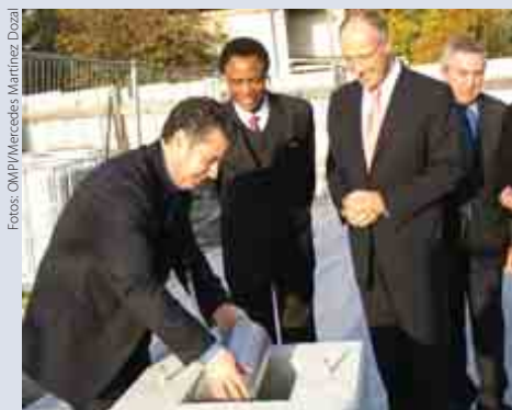
El Director General de la OMPI, Francis Gurry, y el Presidente de la Asamblea General de la OMPI, Embajador Uhomobhi de Nigeria, observan como es colocado el cilindro en su cámara de hormigón.

El 7 de noviembre se colocó la primera piedra del nuevo edificio de la OMPI. Durante la ceremonia oficial, diversos objetos simbólicos destinados a despertar la curiosidad e instruir a generaciones futuras se introdujeron en un cilindro de acero que quedó incorporado a un bloque de hormigón de los cimientos del edificio. Entre estos objetos figuran el Convenio de la OMPI, la bandera de la OMPI, una medalla conmemorativa de la OMPI, la Carta de las Naciones Unidas, una copia del comprobante de venta del terreno, el cuadernillo del concurso de arquitectura, una selección de proyectos del arquitecto, una copia del contrato suscrito con el contratista general, una llave USB con fotografías de la obra tomadas desde que se iniciaron las excavaciones en abril de 2008, un ejemplar del boletín oficial de ese día ( Feuille d'avis officielle ), monedas suizas de 2008 y el programa de la ceremonia.