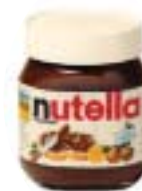
NUTELLA® reproduction autorisée par Ferrero S.p.A.

sociétés choisissent aussi d'utiliser une nouvelle marque parallèlement à une marque existante (c'est par exemple le cas de Ferrero et Nutella).