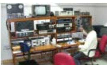
Numérisation au Centre d'Archivage et de Recherche en Ethnomusicologie à Gurgaon (Inde)