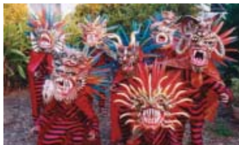
Danse des Diablos, Panama

L'opportunité d'utiliser les nouvelles techniques et les instruments de la propriété intellectuelle pour participer à l'économie de l'information est subordonnée aux objectifs