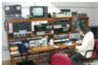
Digitalización en el Centro de Archivos e Investigación sobre Etnomusicología en Gurgaon (India)

Muchas instituciones han elaborado ya valiosos protocolos, políticas y prácticas relacionados con la P.I. y con la salvaguardia del patrimonio cultural, el acceso al mismo, su titularidad y su control.