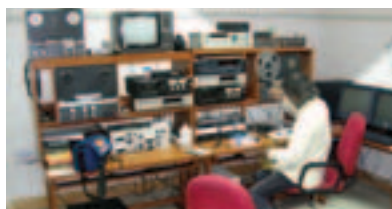
Преобразование данных в цифровую форму в архивах и Исследовательском центре этнической музыки в Гургаоне, Индия.

По заказу ВОИС внешние эксперты провели обзоры таких существующих ресурсов и практических методов. На основе этих обзоров подготовлена подборка коротких тематических исследований .