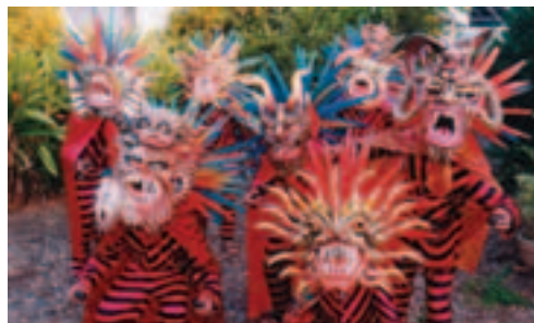
‘Танец грязных дьяволов’, Панама

Такие передовые методы и руководящие принципы будут в полной мере дополнять инструментарий,