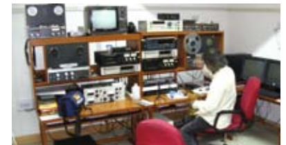
الرقمنة في مركز المحفوظات والبحث للموسيقى الإثنية في غورغاون (الهند)

وجمعت الويبو أيضاً قاعدة بيانات يمكن البحث فيها وتحتوي على البروتوكولات والسياسات والممارسات الموجودة في مجال الملكية الفكرية .