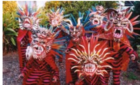
جمعية ميخيل ليغزامو للرقص رقصة الشياطين (بنما)

وتؤازر هذه الممارسات والمبادئ التوجيهية ما يتم تطويره حالياً من أدوات في منتديات عديدة بشأن توثيق المعارف التقنية التقليدية مثل المعارف ذات الصلة بالحفاظ على التنوع البيولوجي.