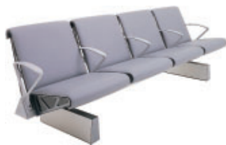
S láskavým dovolením TRAX®

spoločnosti OMK Design Ltd. výlučné práva obchodovať s výrobkom v spomenutých krajinách. Spoločnosť príležitostne poskytne licenciu na výrobu verejných sedadiel TRAX aj zahraničným spoločnostiam za úhradu licenčných poplatkov.