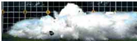
Essai de détonation d'une bombe aérosol.