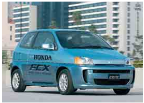
Honda présente le véhicule conceptuel FCX, voiture électrique à pile à combustible de la prochaine génération entièrement fonctionnelle. Honda a déposé plus de 40 demandes de brevet PCT ayant trait aux piles à combustible.

un prix inférieur à 10 000 dollars. La société, qui a commencé à recourir au PCT en 2003, a déposé 10 demandes internationales de brevet publiées pour sa technologie des piles à combustible, notamment pour "Core", qui est la pile qui équipe la moto en question, et qui peut en être détachée pour alimenter un bateau ou une petite maison.