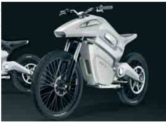
La moto ENV: silencieuse et élégante

À l'heure actuelle, le ravitaillement en combustible reste un problème pour les clients, à moins qu'ils ne vivent en Californie, qui a prévu de construire entre 150 et 200 stations de ravitaillement en hydrogène d'ici à 2010. Un certain nombre de constructeurs envisagent de régler le problème en fournissant à leurs clients des systèmes de ravitaillement en hydrogène à installer chez eux. Honda vient de présenter un système individuel de troisième génération mis au point avec la société américaine de fabrication de piles à combustible Plug Power, Inc. Et GM, dont le vice-président Bob Lutz est convaincu que les piles à combustible pourraient faire entrer la compagnie dans une nouvelle ère de prospérité, prévoit de sortir en 2011 un modèle individuel pouvant fabriquer de l'hydrogène à partir soit de l'électricité, soit de la lumière du soleil. Cette année, GM se propose de faire essayer aux consommateurs 100 SUV Chevrolet Equinox à pile à combustible.