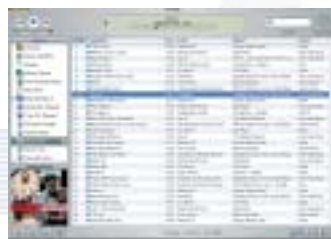
iTunes music store

brèche aujourd'hui le piratage numérique en offrant une solution légale de téléchargement de fichiers musicaux.