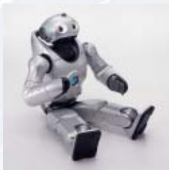
El robot Qrio de Sony

de técnicas complejas de control de los movimientos para sus robots de aspecto humano.