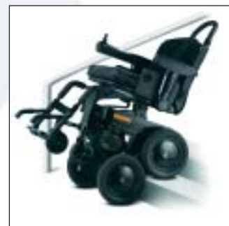
Sistema de desplazamiento autopropulsado Independence® iBot™ 3000