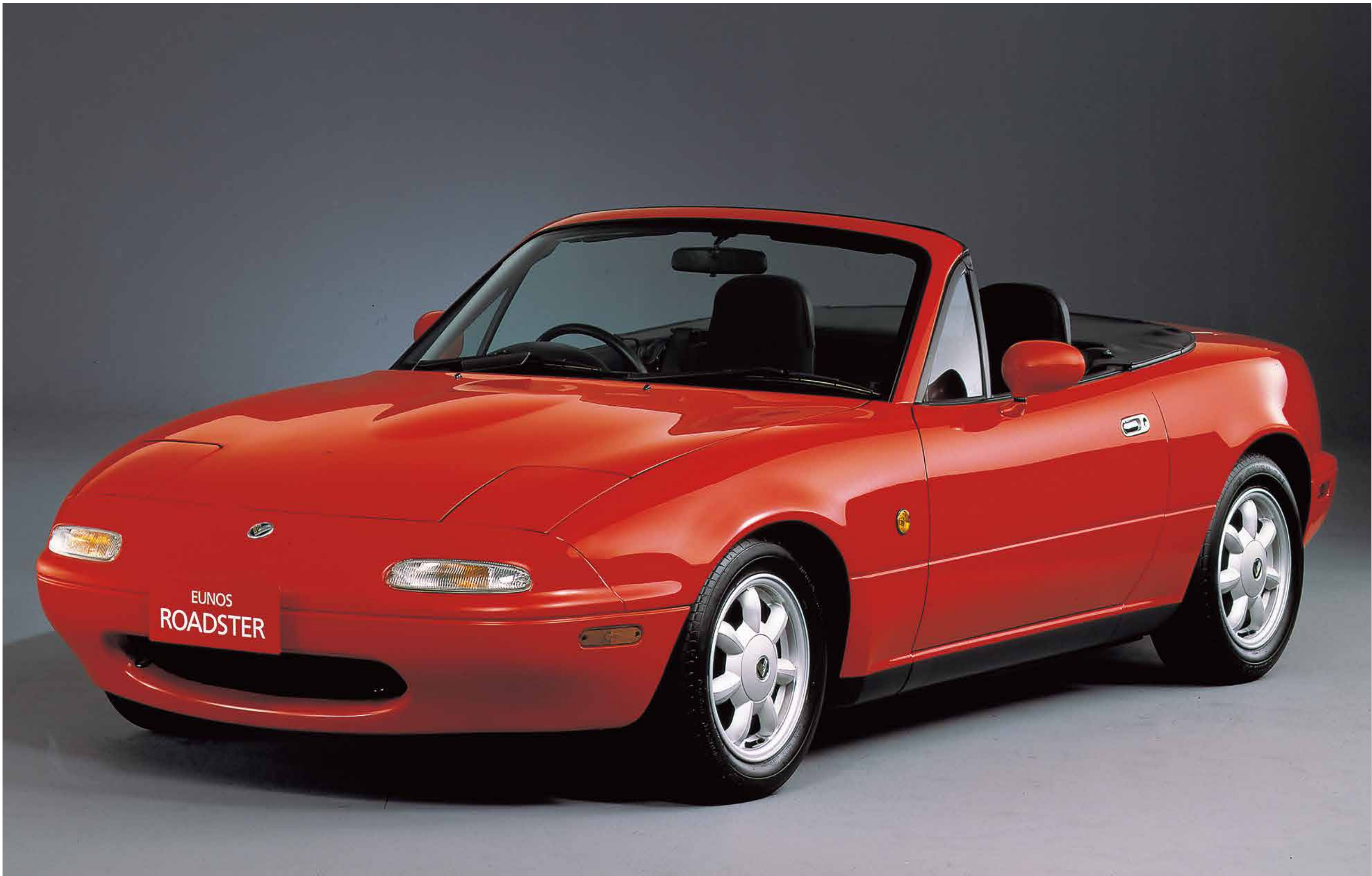
ユーノス ロードスター（初代）（1989） 田中 俊治 マツダ株式会社 意匠登録第790594号