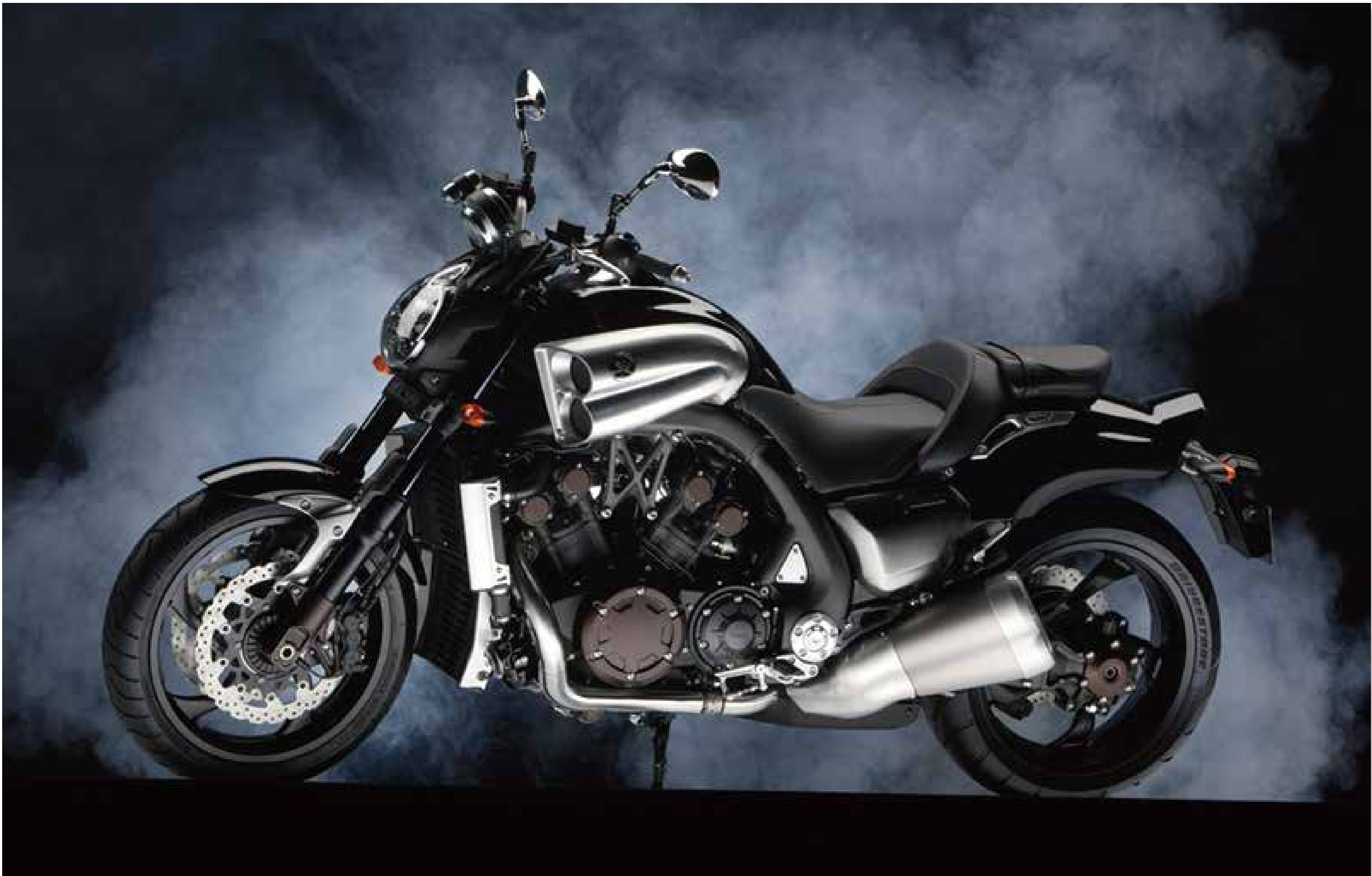
VMAX 2代目 (2008) ヤマハ発動機株式会社