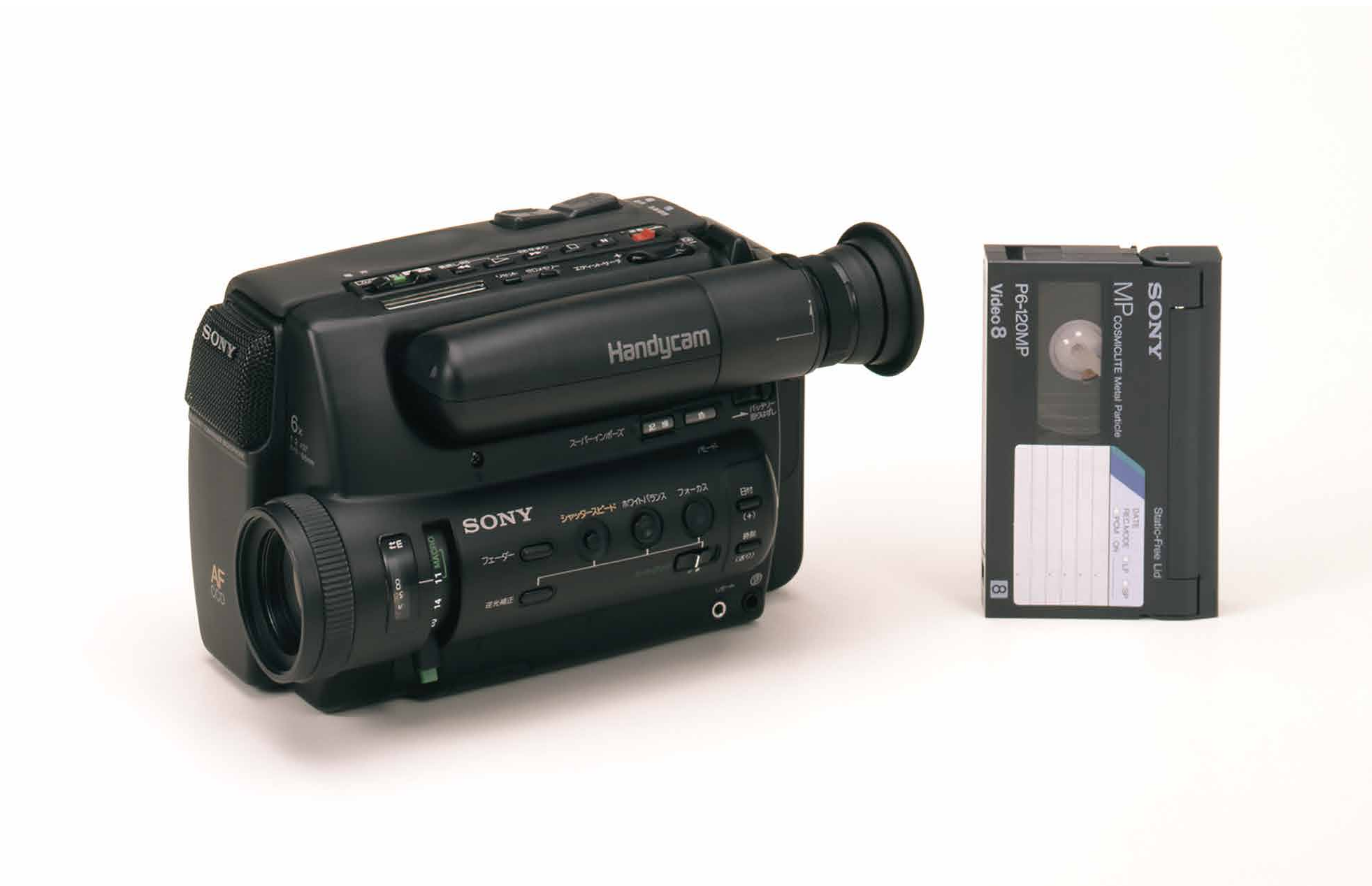
ハンディカム® CCD-TR55 (1989)