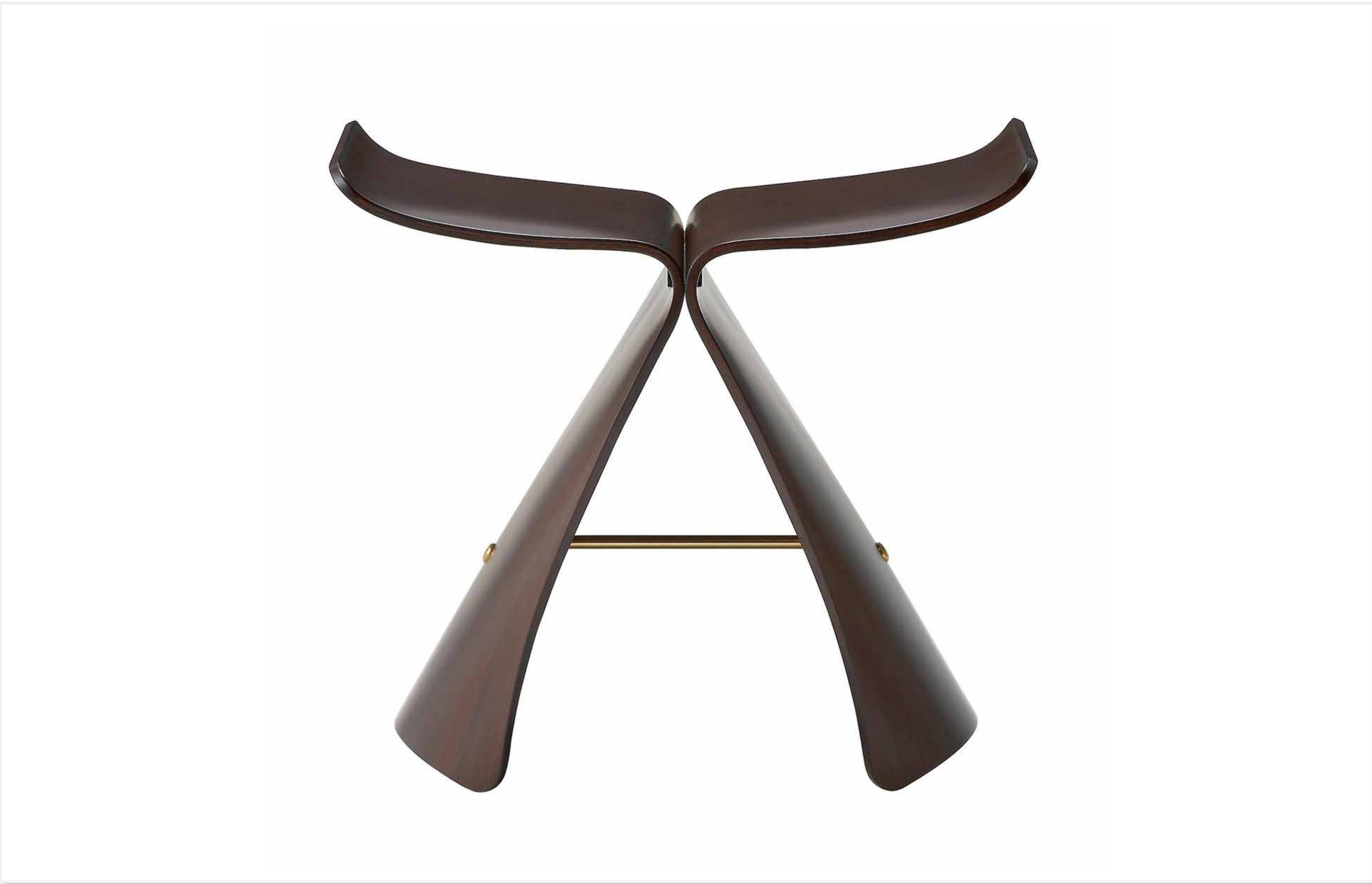
バタフライスツール (1956) 柳 宗理