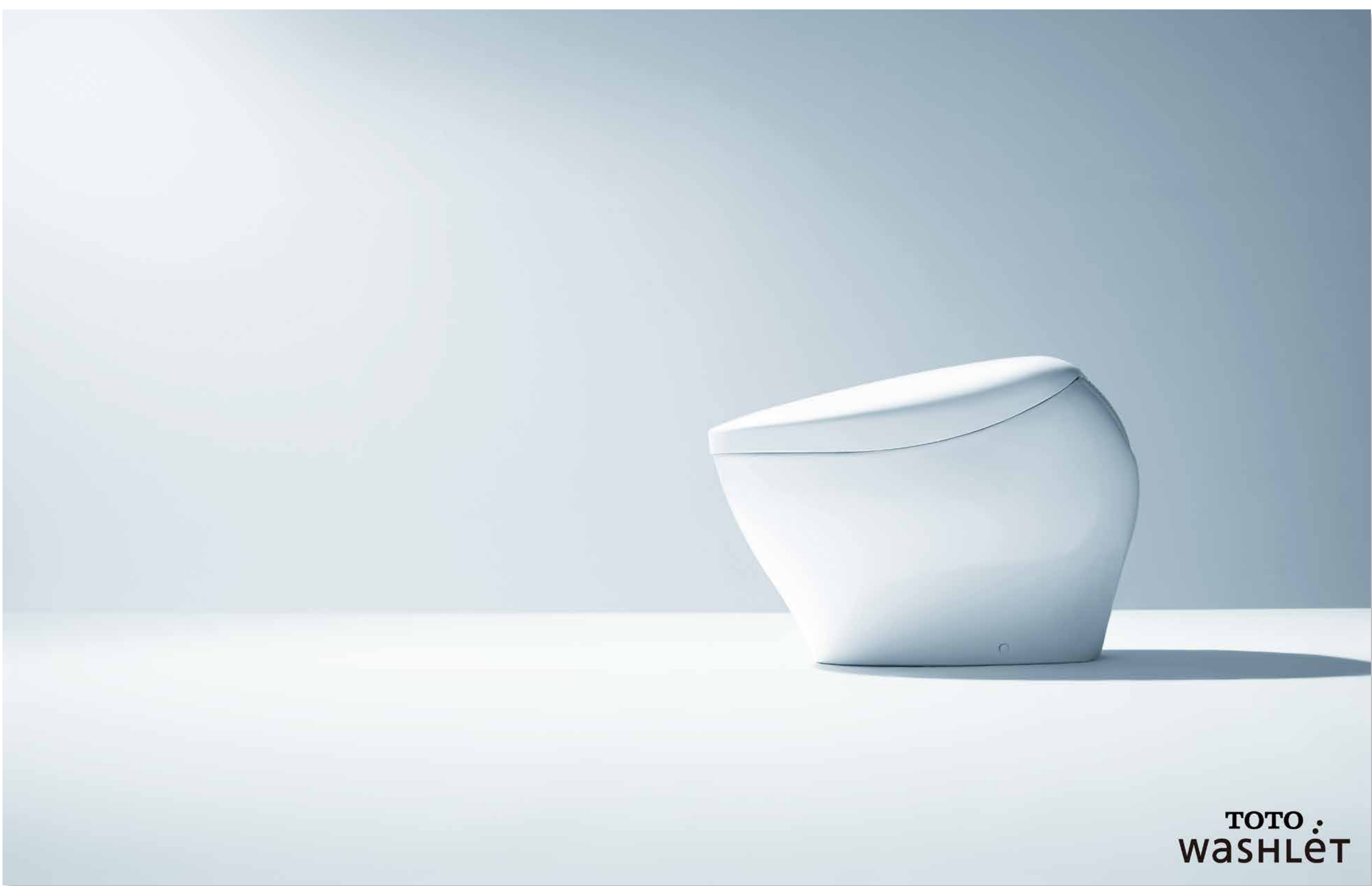
ネオレストNX (2017) 吉岡 佐二 中林 大郎 谷 穂 TOTO 株式会社 画像：ネオレストNX (2022) 意匠登録第1558397号他