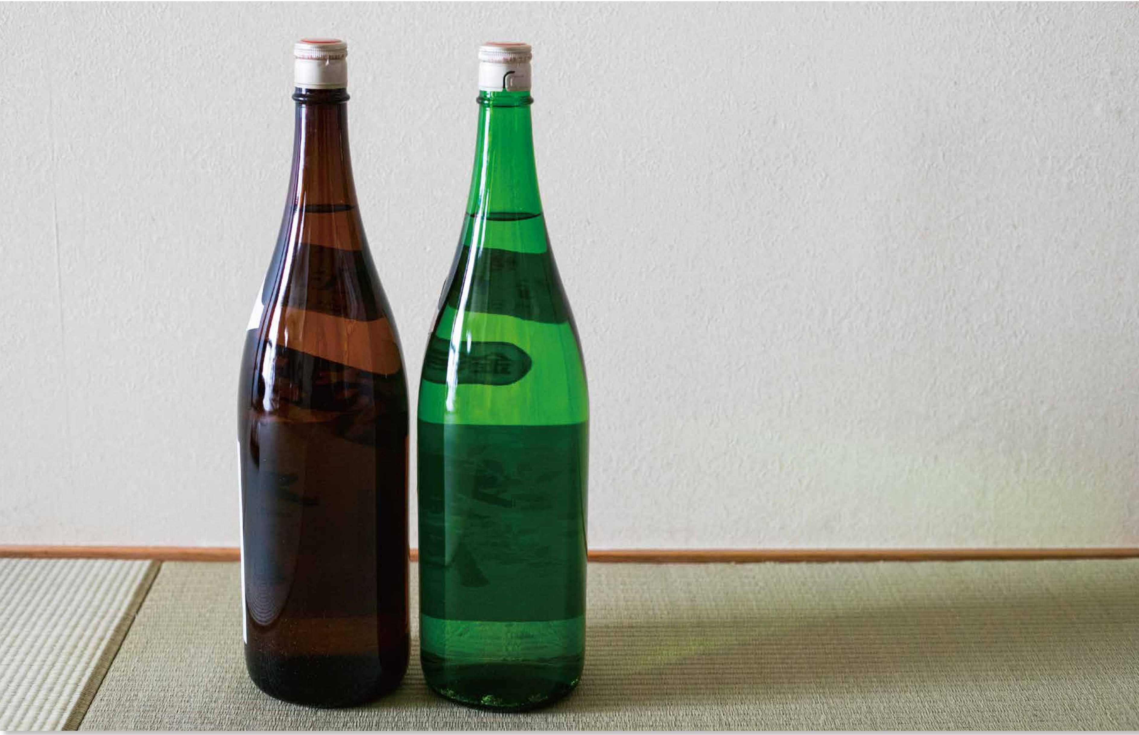
日本酒の一升瓶 (1900年頃)