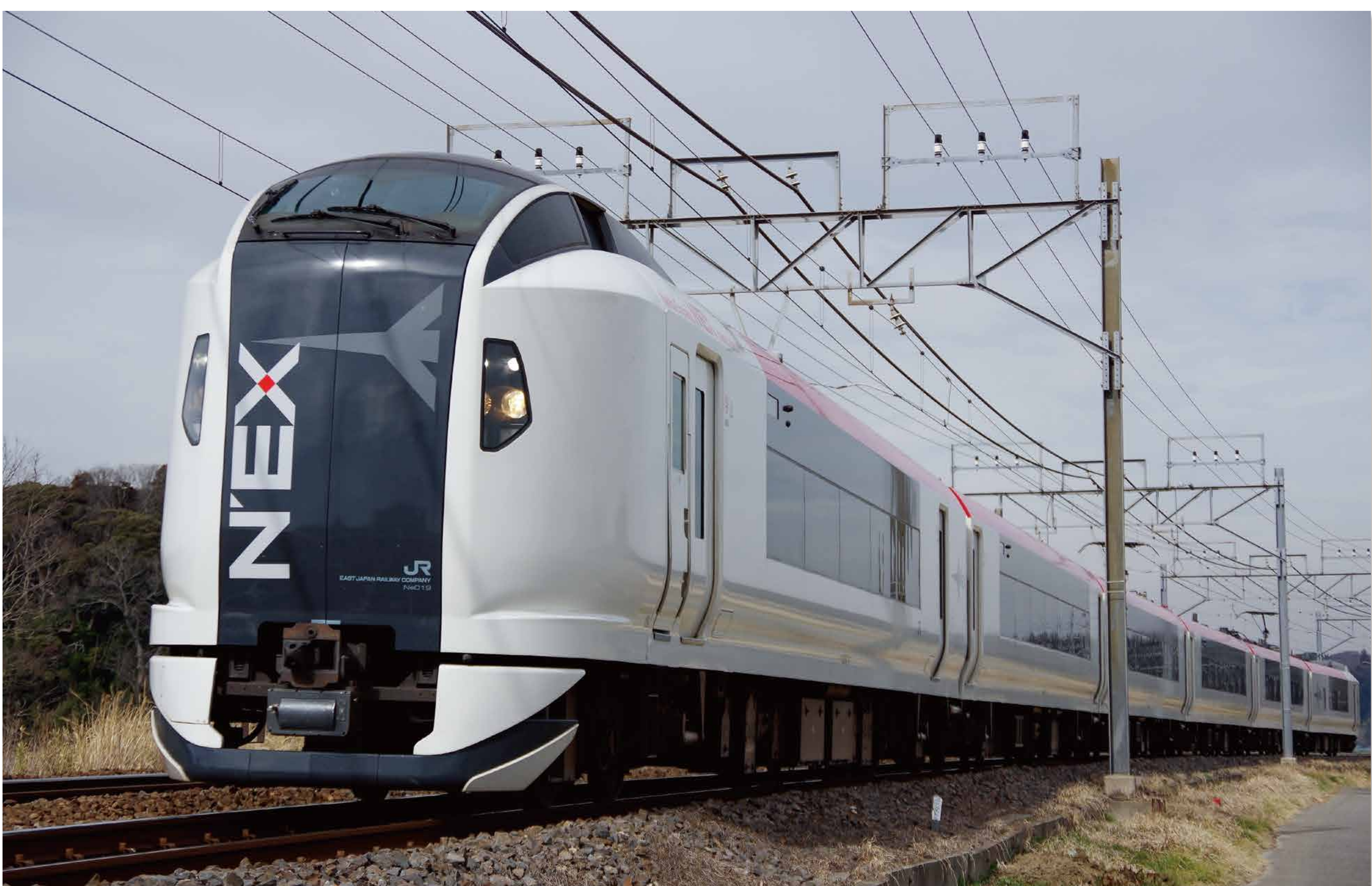
JR 東日本 E259 系電車 (2009) GK インダストリアルデザイン 東日本旅客鉄道株式会社