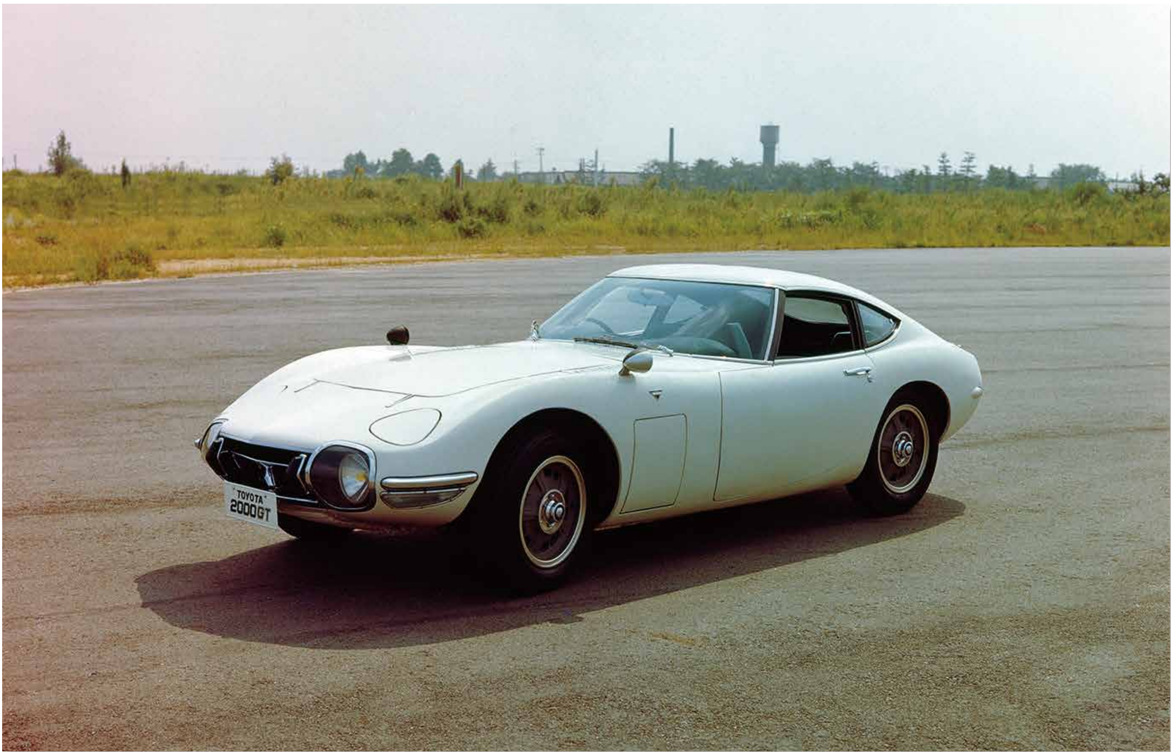
2000GT (1967) トヨタ自動車株式会社