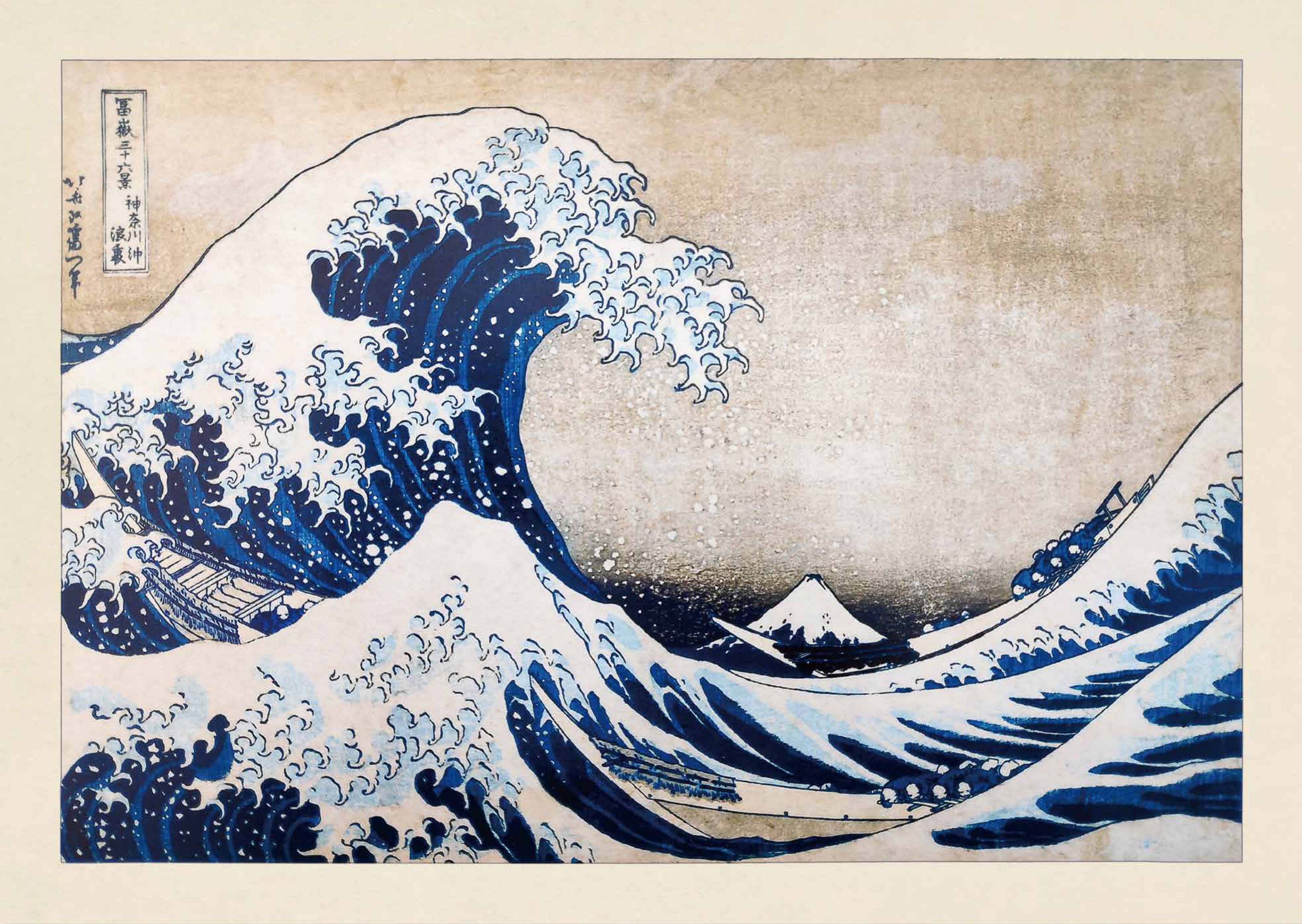
富嶽三十六景 神奈川沖浪裏 (1830年頃) 葛飾北斎