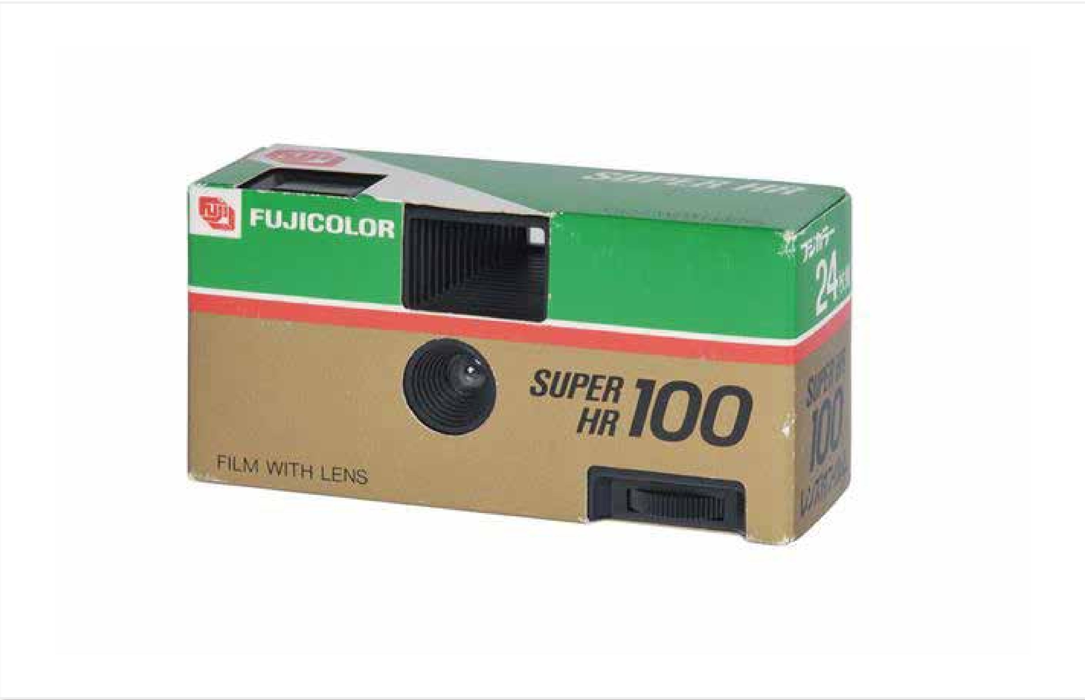
フジカラー 写ルンです (1986) 富士写真フイルム株式会社 意匠登録第 760922 号