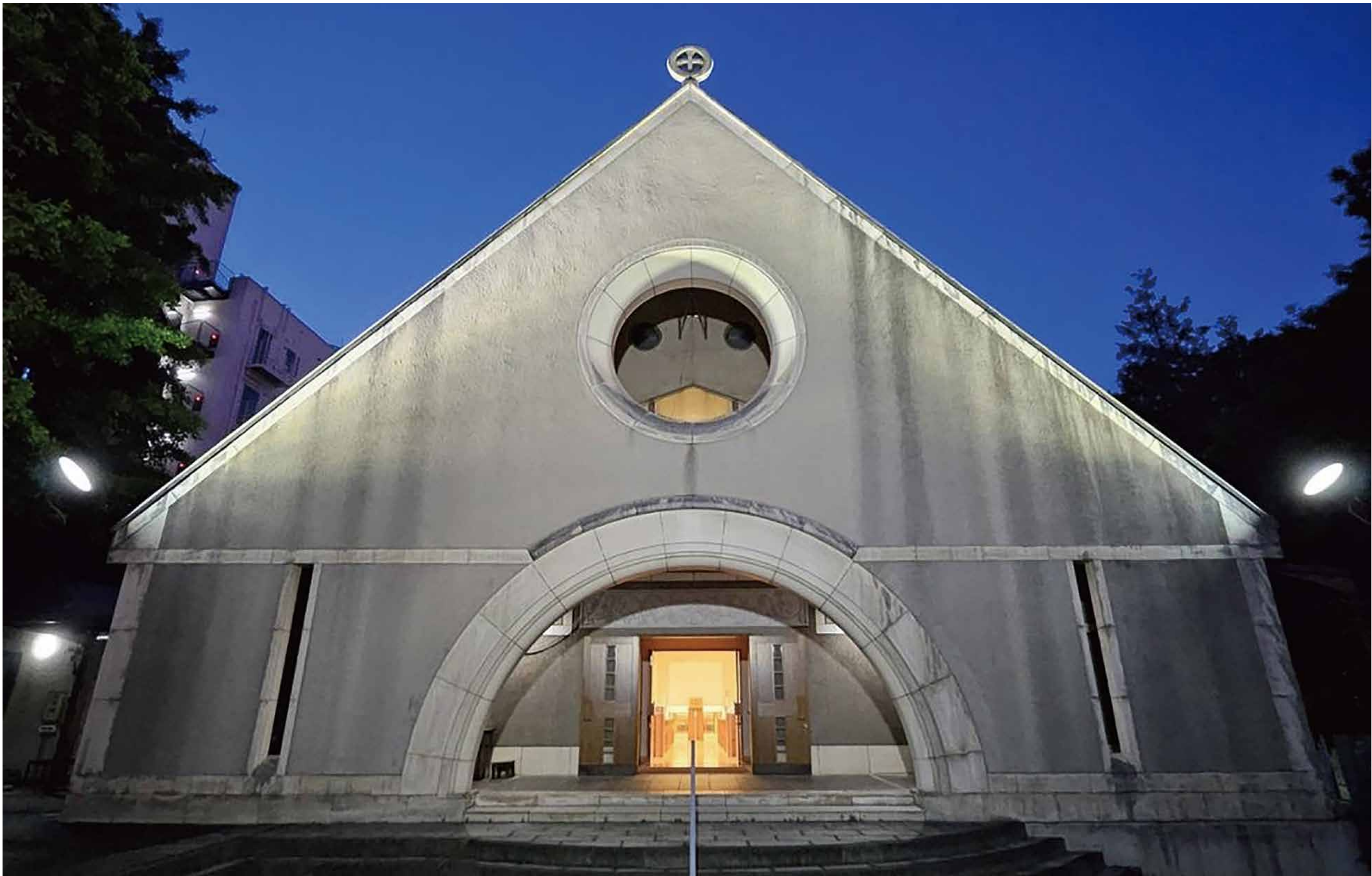
聖アンデレ教会 (1996) 香山 壽夫