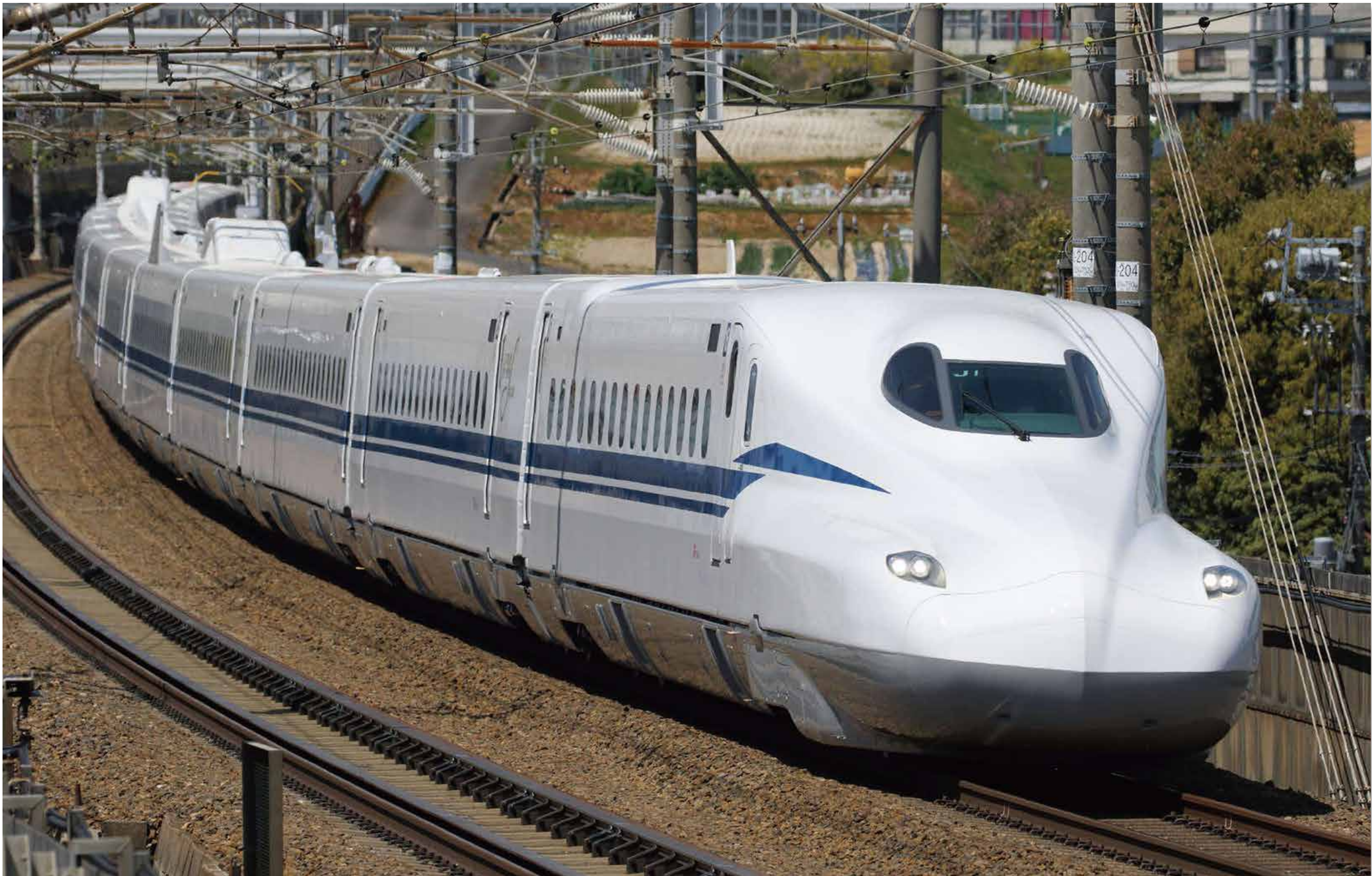
新幹線 N700S 電車 (2020) 福田 哲夫 福田 一郎 木村 一男 蓮見孝 井上 雅弘 東海旅客鉄道株式会社 エイアンドエフ株式会社