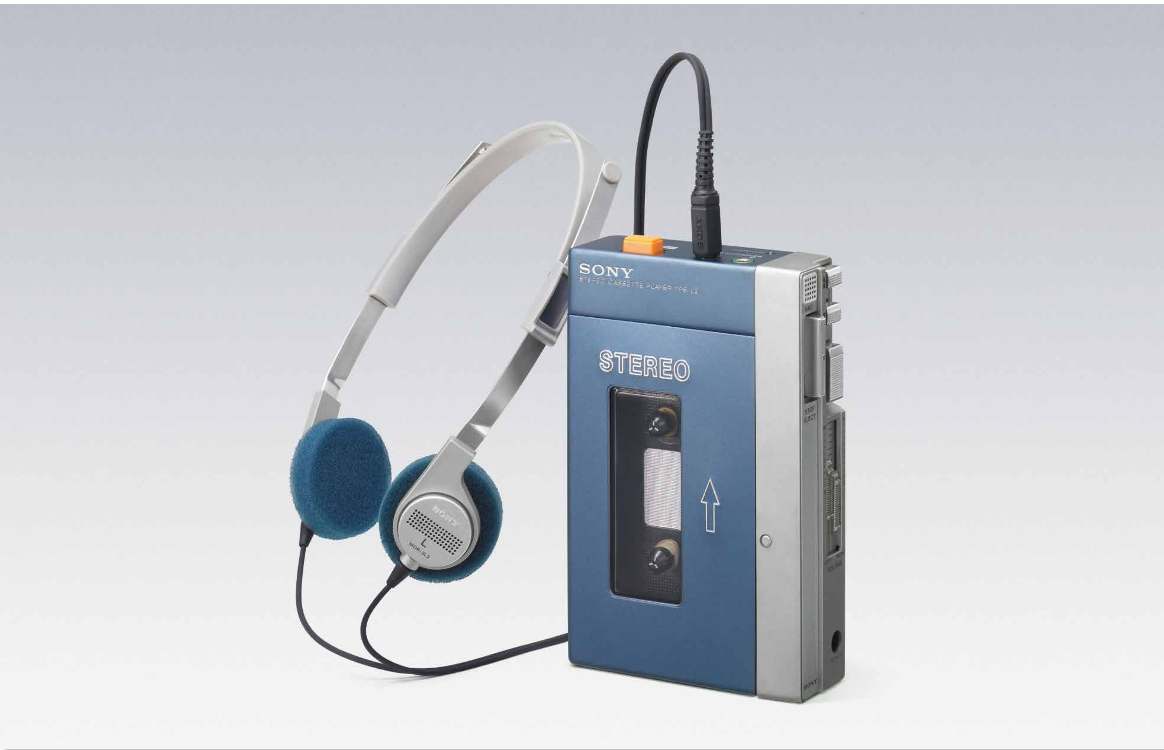
ウォークマン® TPS-L2 (1979)