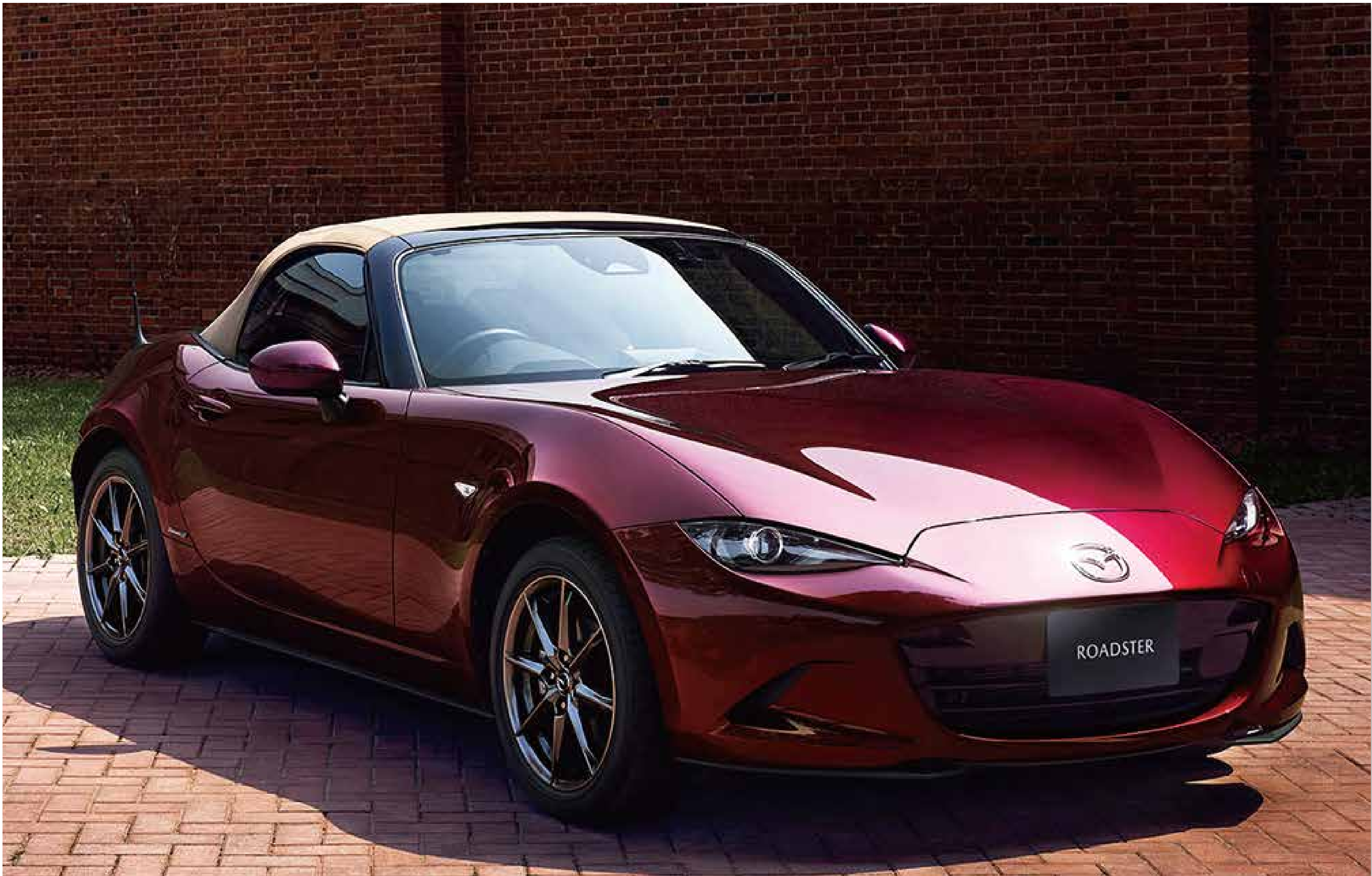
ロードスター（4代目）(2015) マツダ株式会社 意匠登録第1521541号