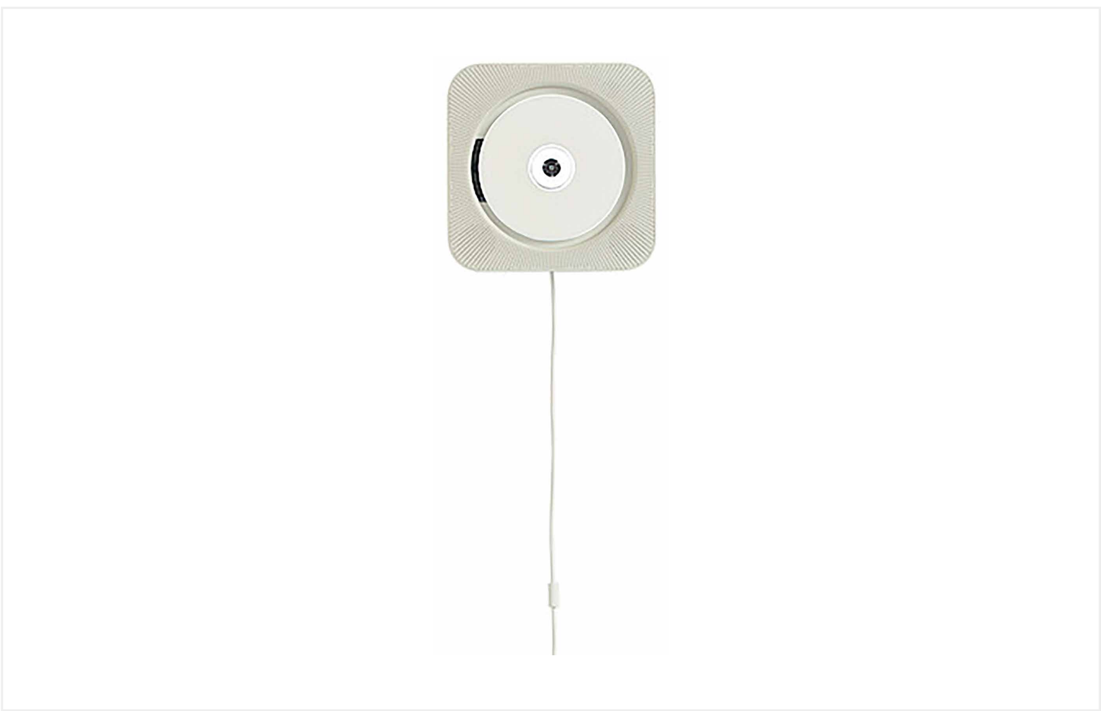
壁掛式CDプレーヤー CPD-4 (2000) 株式会社良品計画