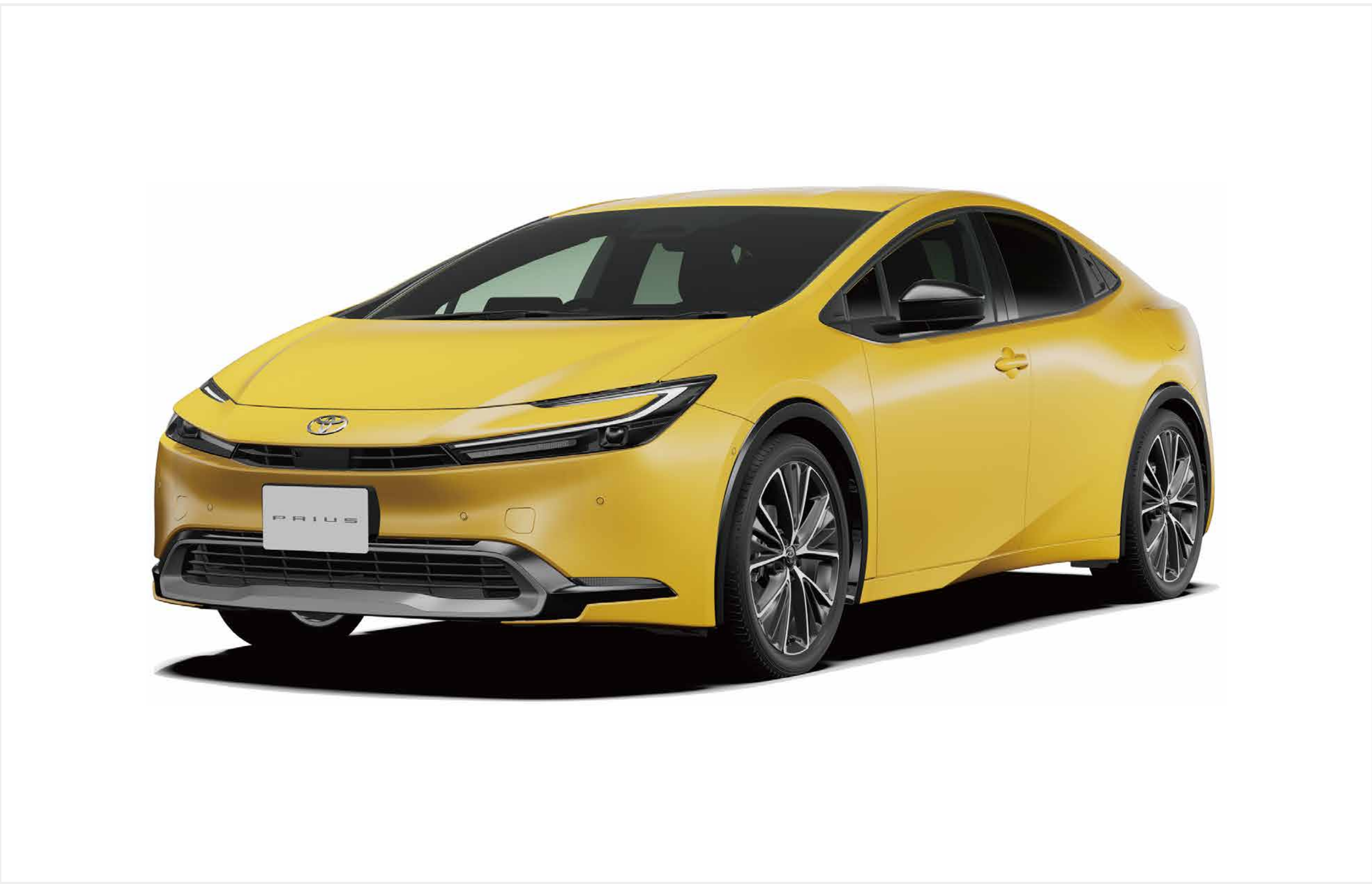
プリウス (2023) トヨタ自動車株式会社