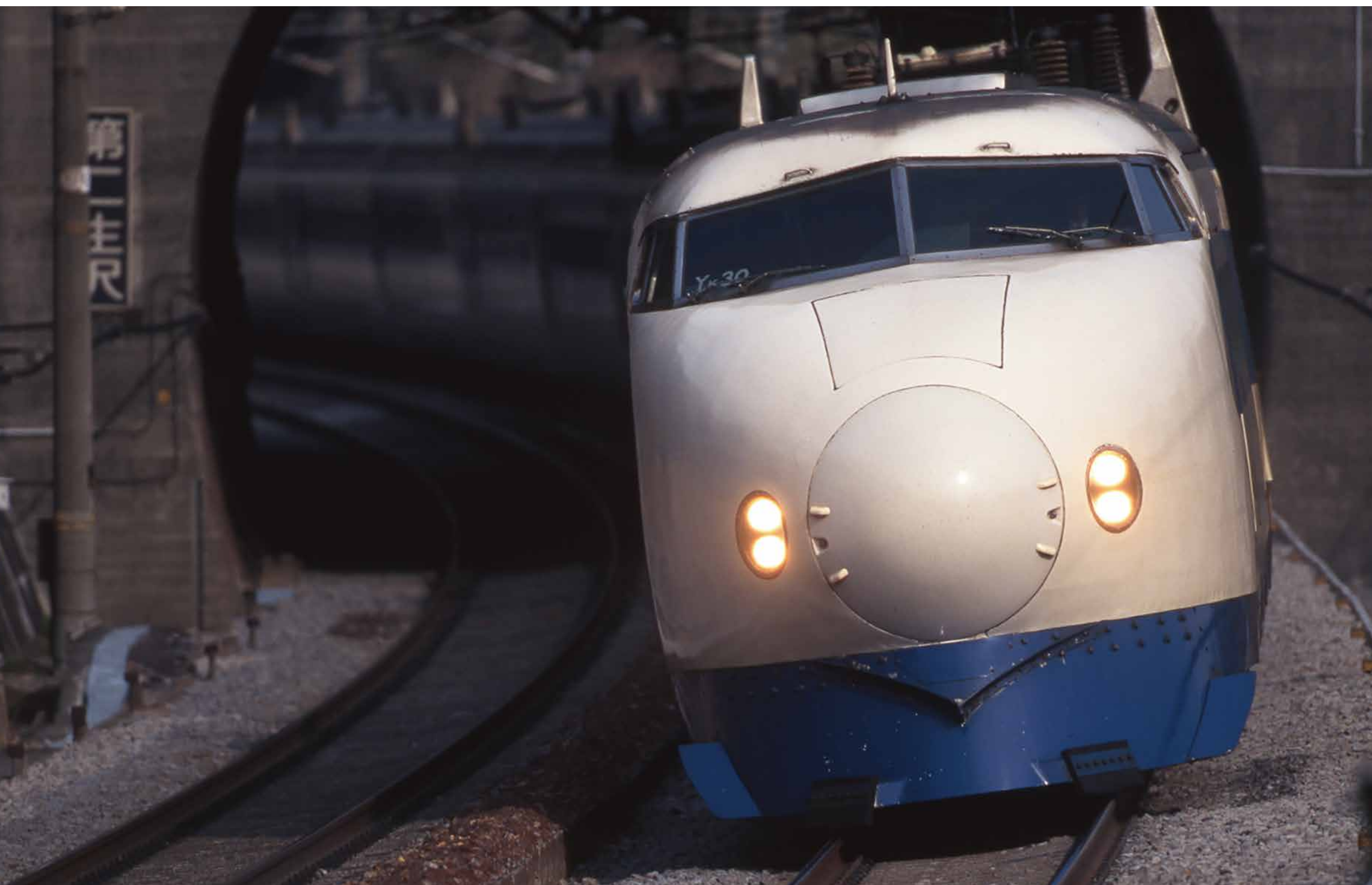
新幹線0系電車 (1964)