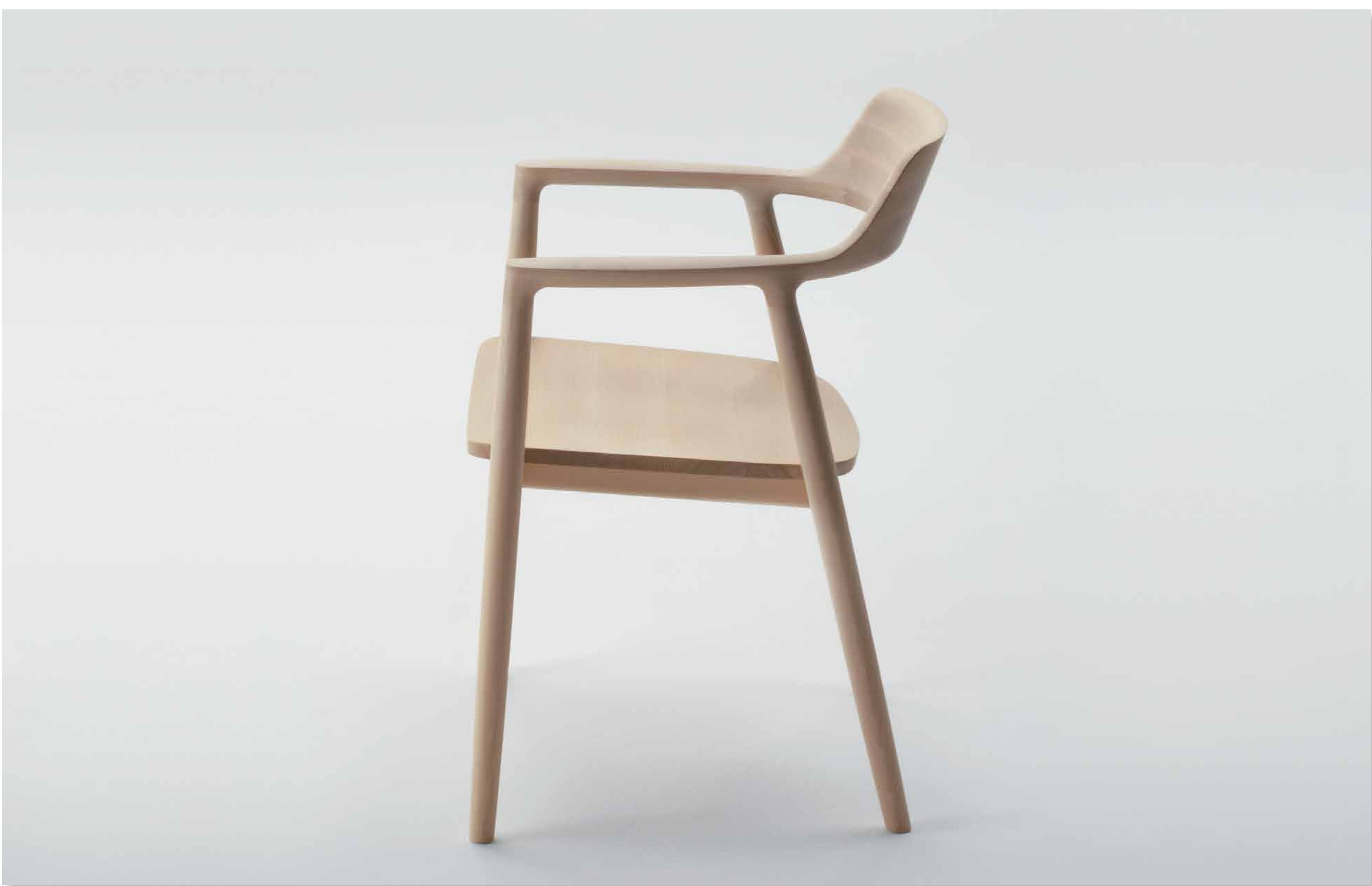
HIROSHIMA アームチェア (2008) 深澤 直人 株式会社マルニ木工