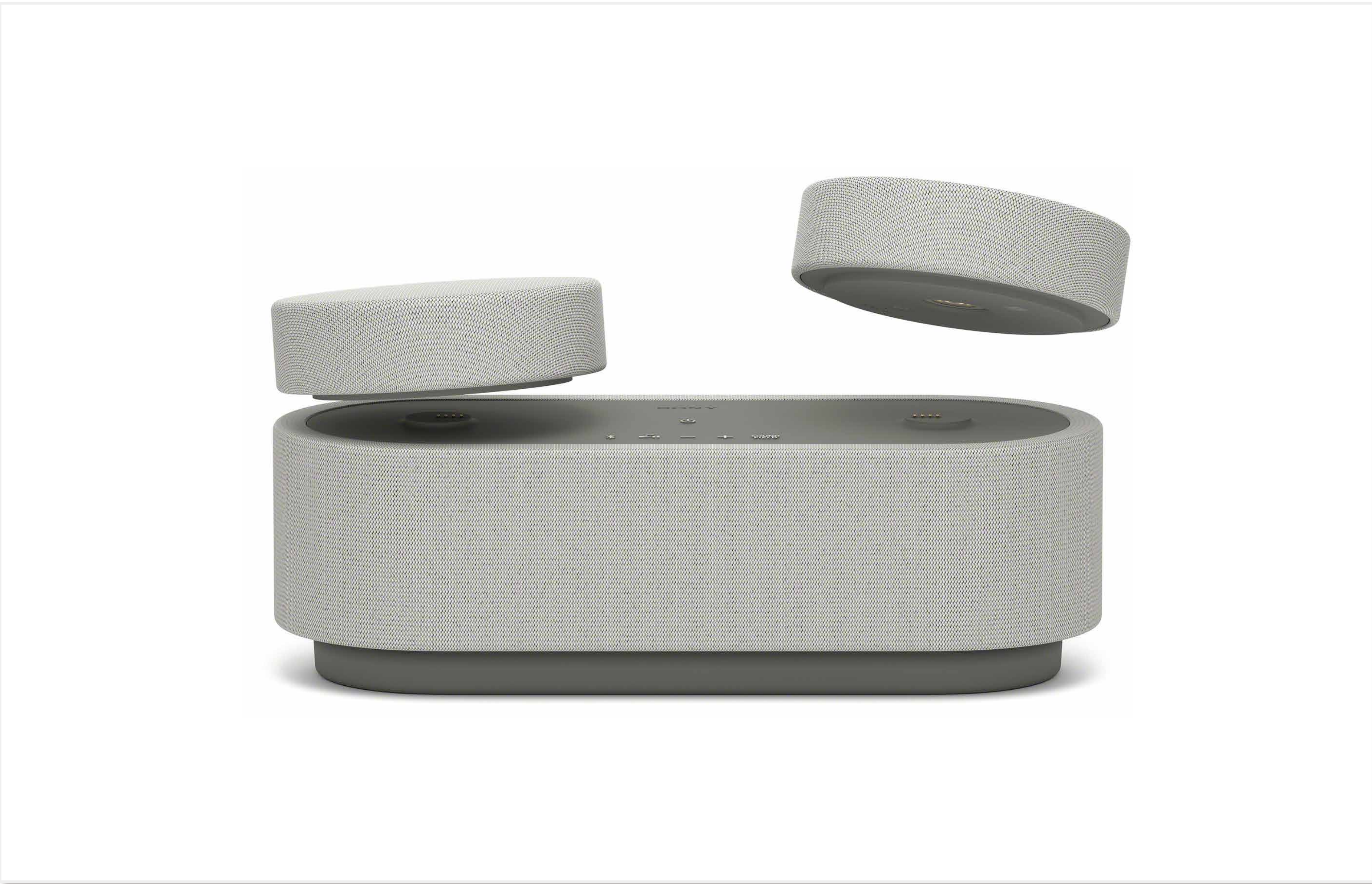
ポータブルシアターシステム HT-AX7 (2023)