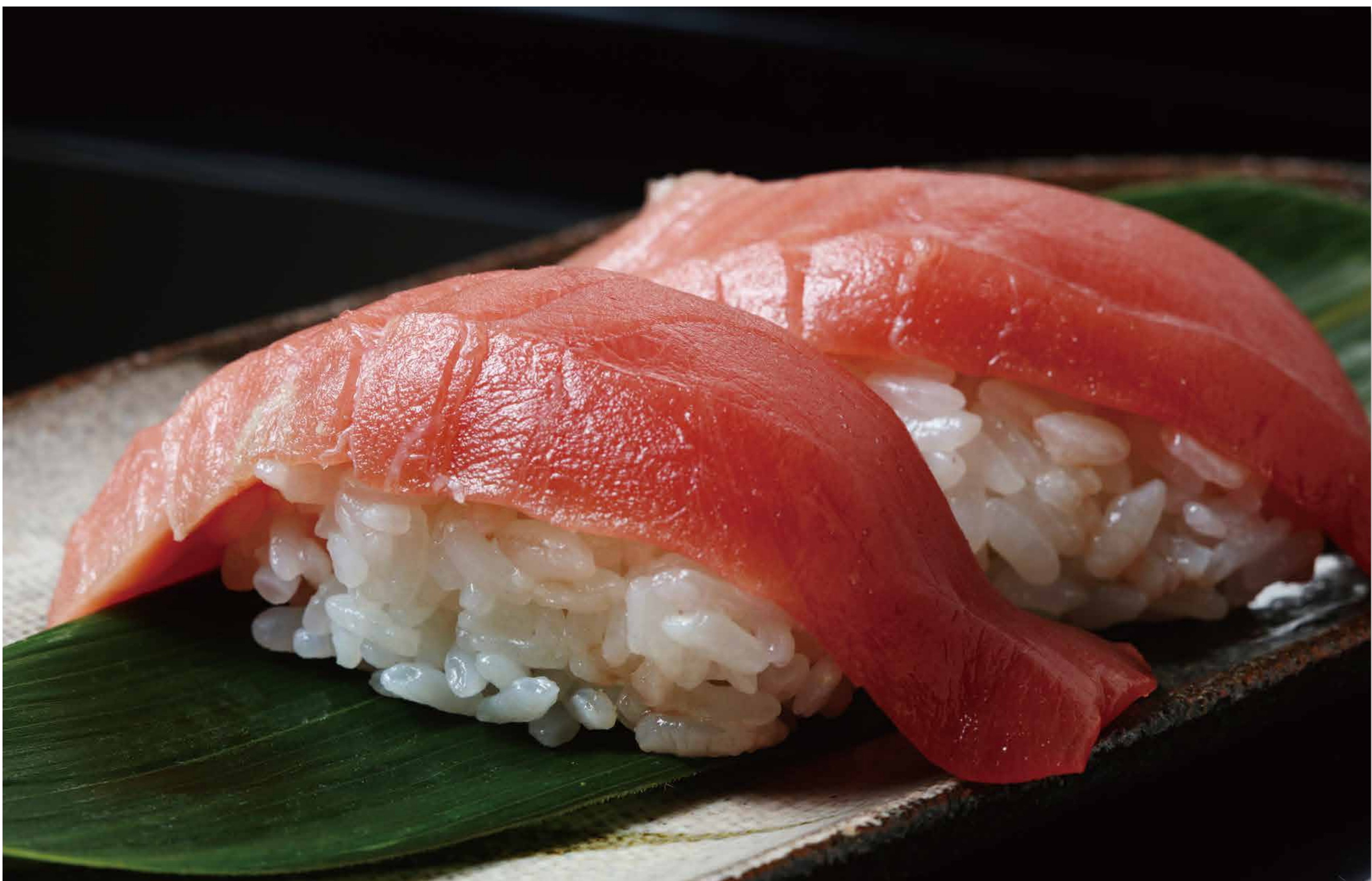
握り寿司（江戸後期）