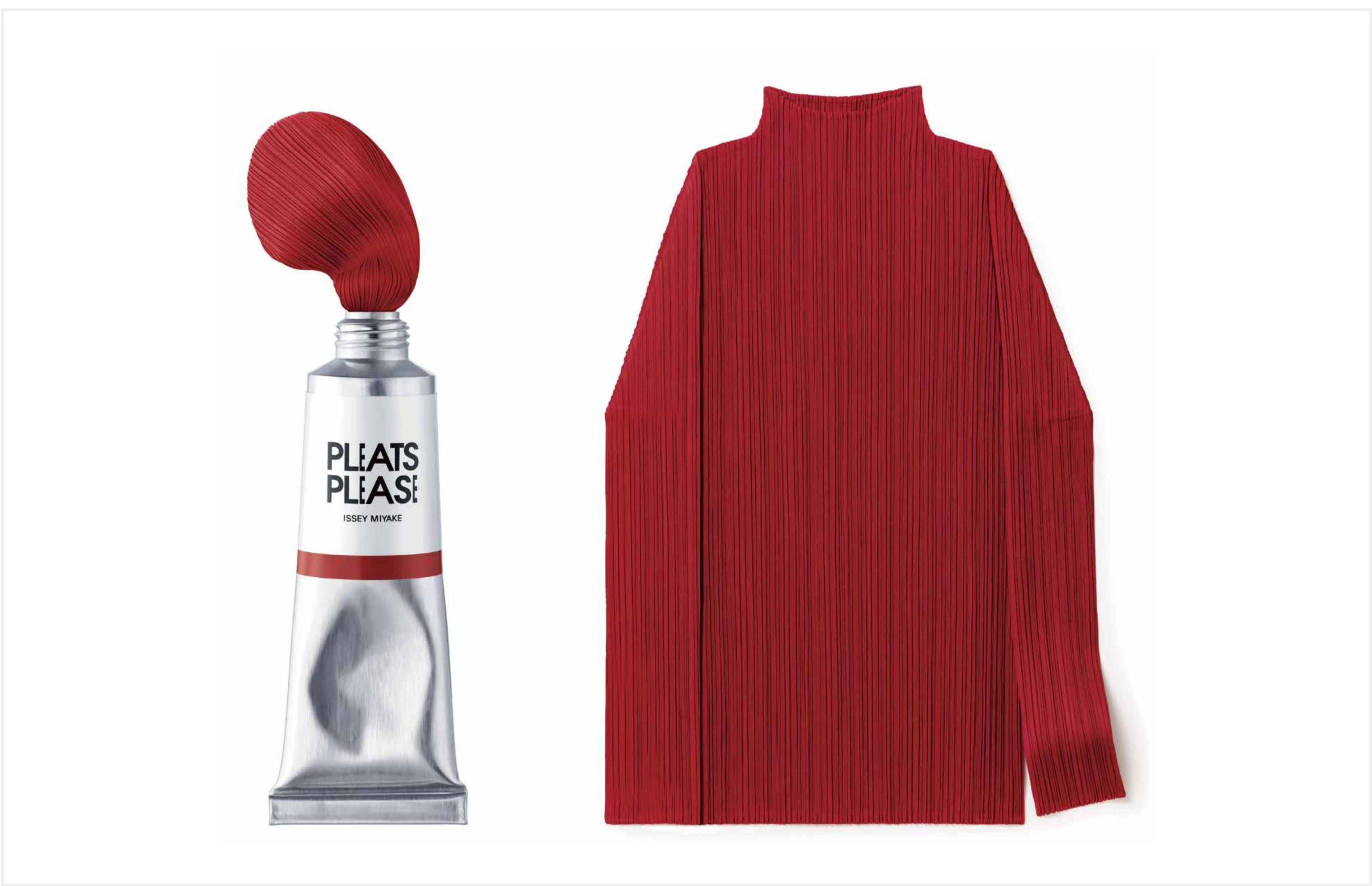
PLEATS PLEASE ISSEY MIYAKE (1993) 三宅 一生 アートディレクション：佐藤 卓