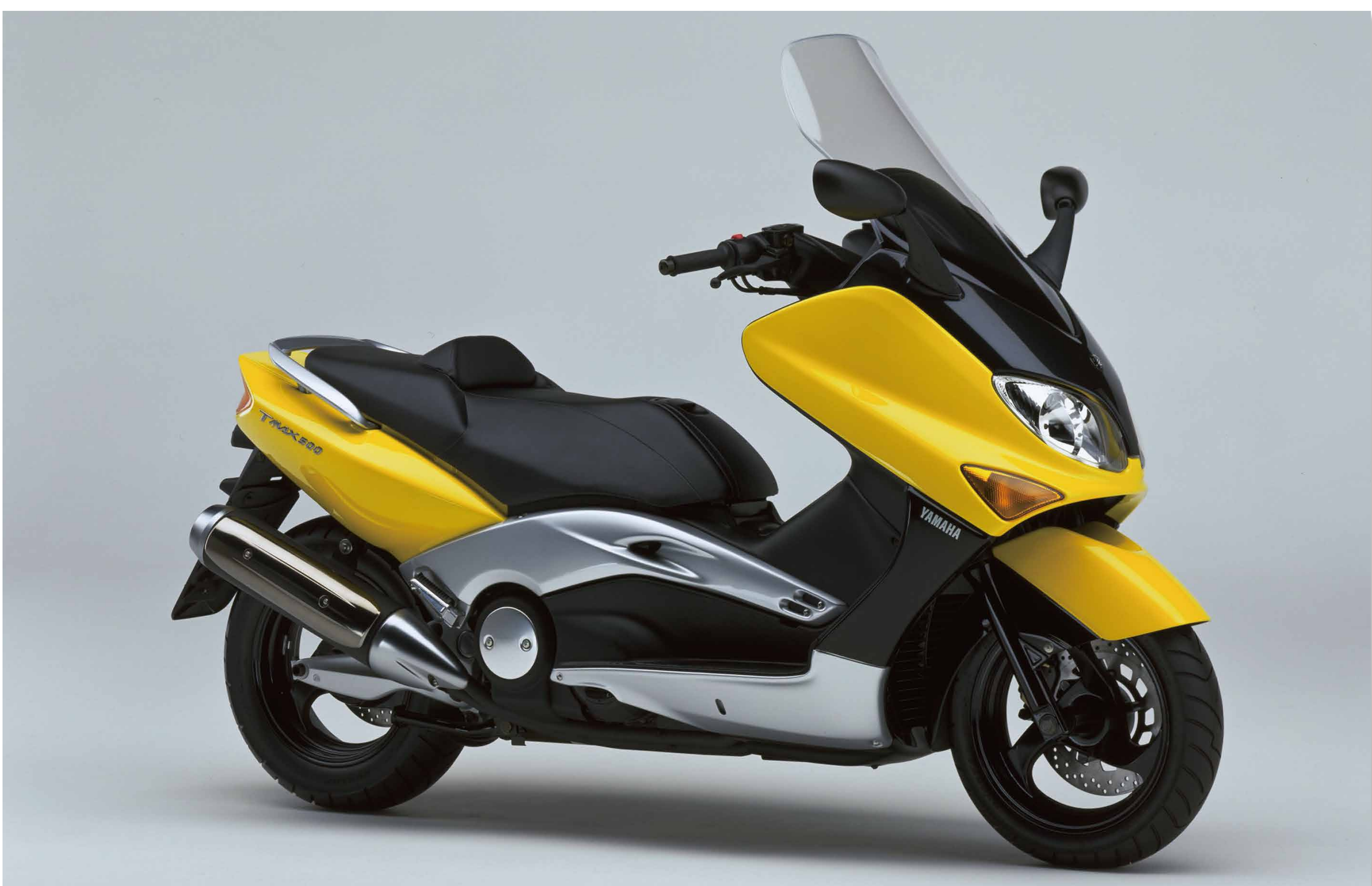
TMAX (2000) ヤマハ発動機株式会社