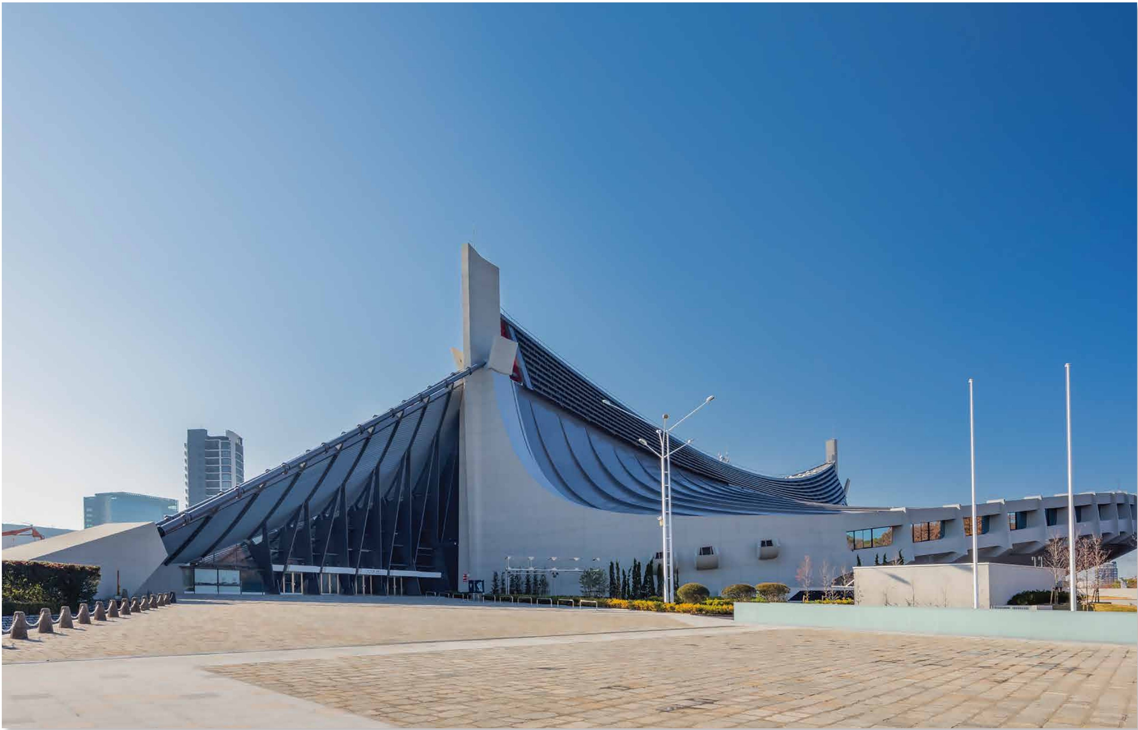
国立代々木競技場第一体育館 (1964) 丹下 健三