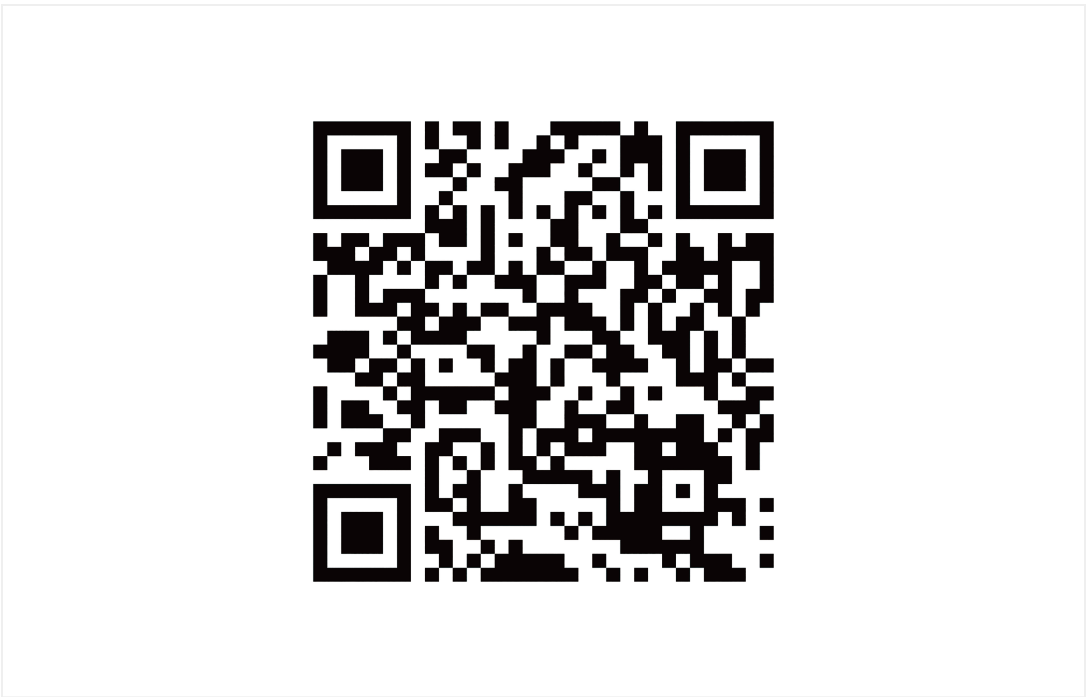
QRコード（1994） 株式会社デンソー 「QRコード」は株式会社デンソーウェブの登録商標です。