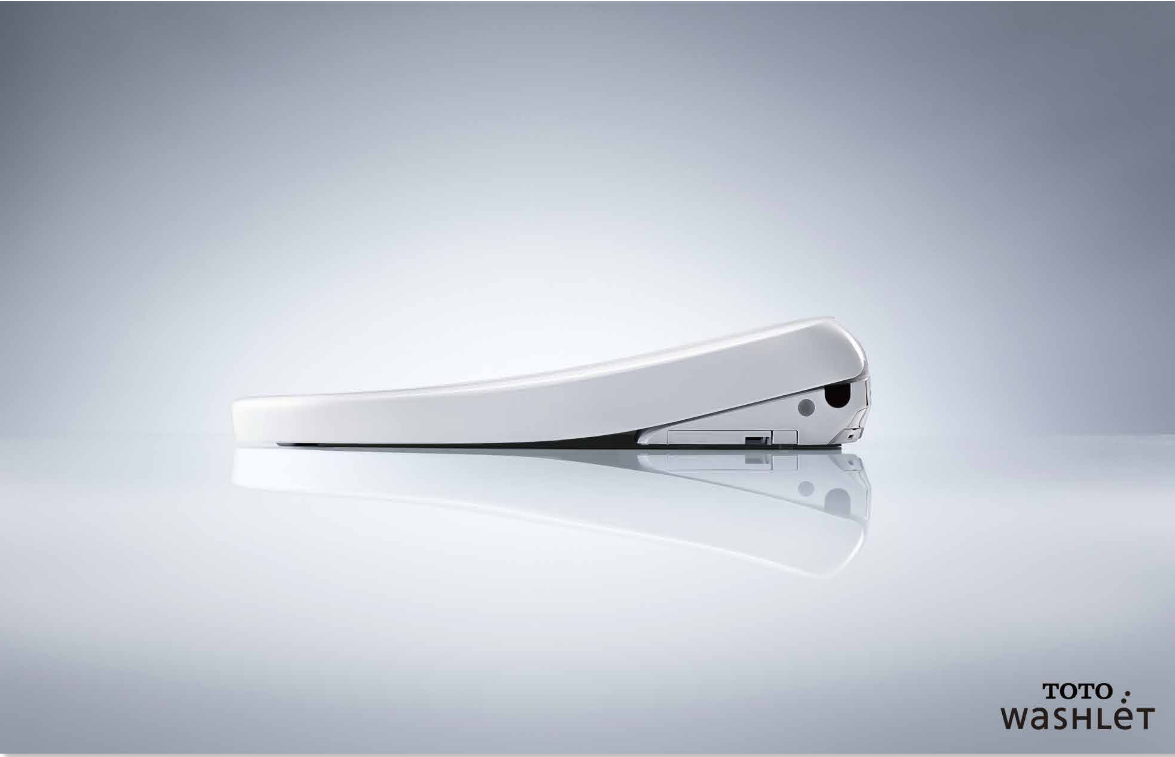
ウォシュレット (1980) TOTO株式会社 画像：ウォシュレット アプリコット (2023)