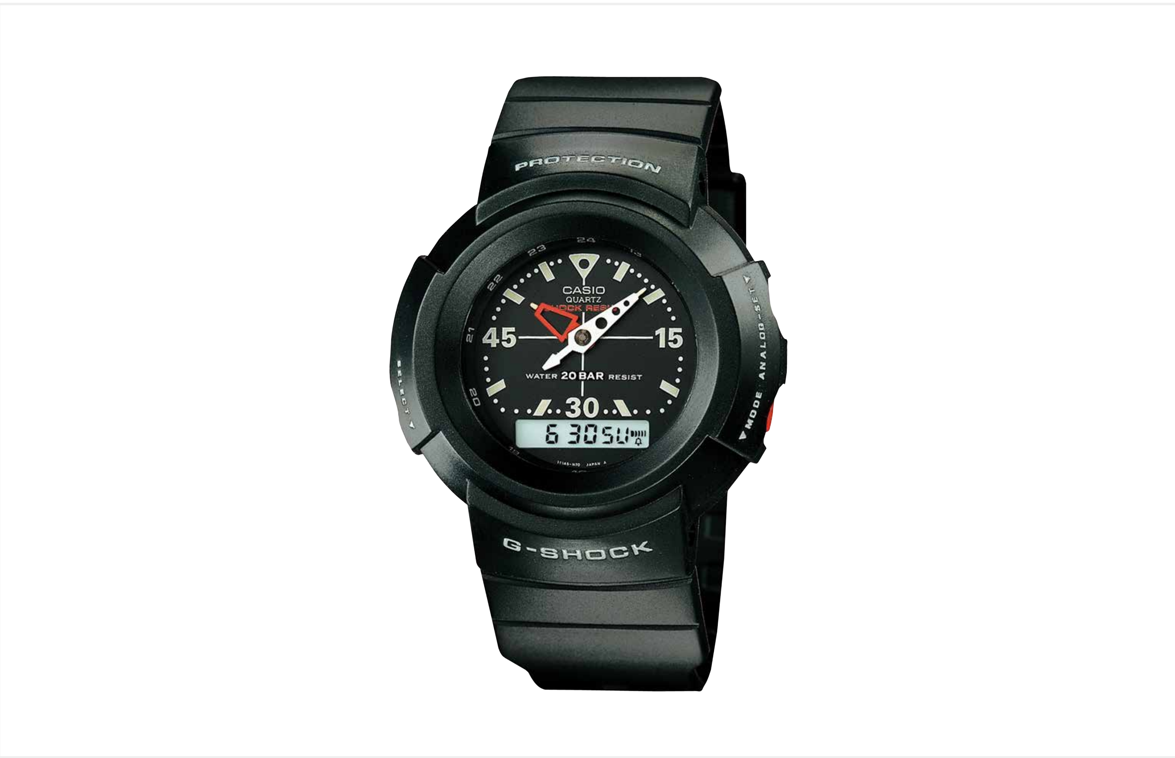
G-SHOCK AW-500 (1989) カシオ計算機株式会社 意匠登録第 842932 号 米国意匠特許第 D320,750 号