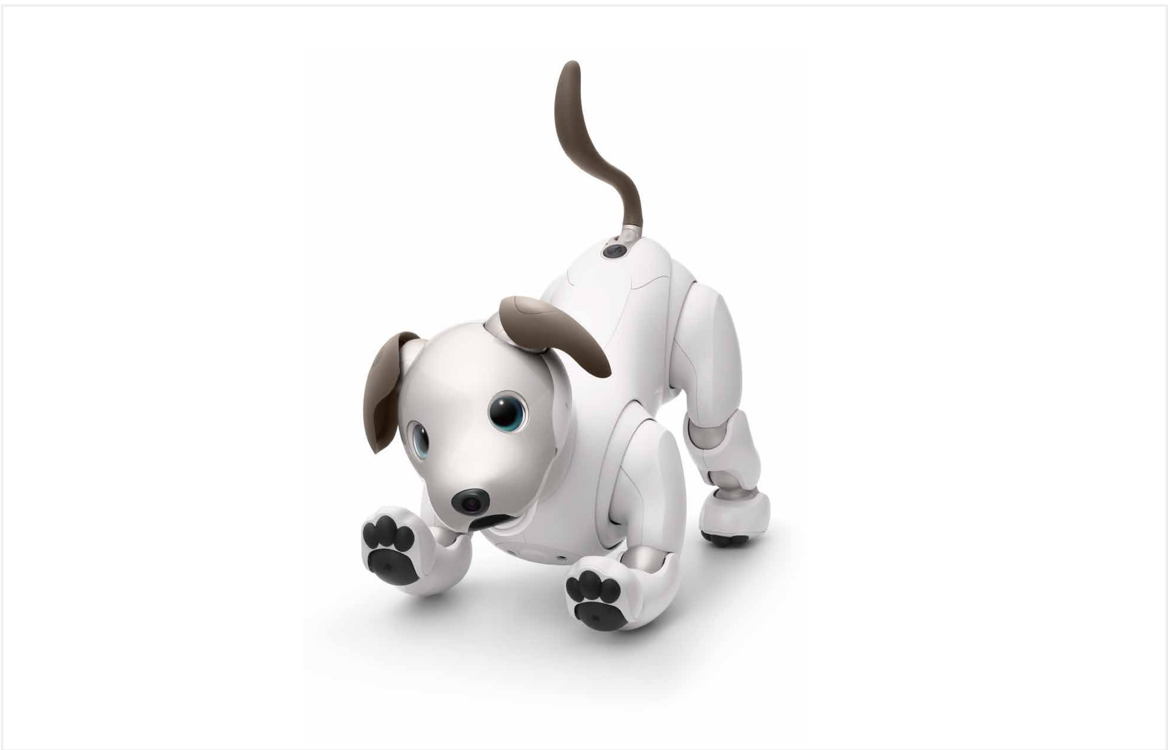
aibo® ERS-1000 (2018)