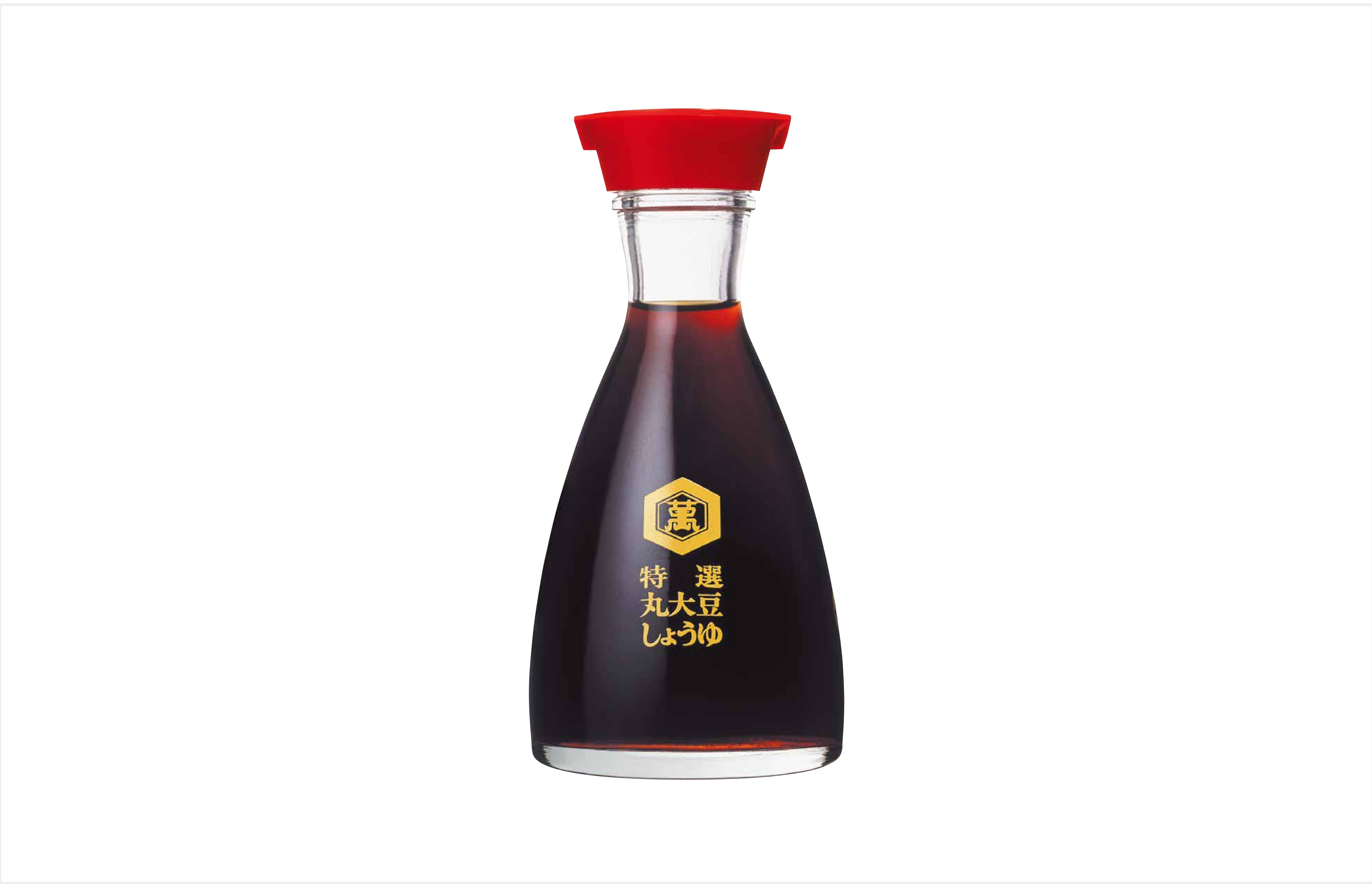
しょうゆ卓上びん (1961) 榮久庵 憲司 キッコーマン株式会社