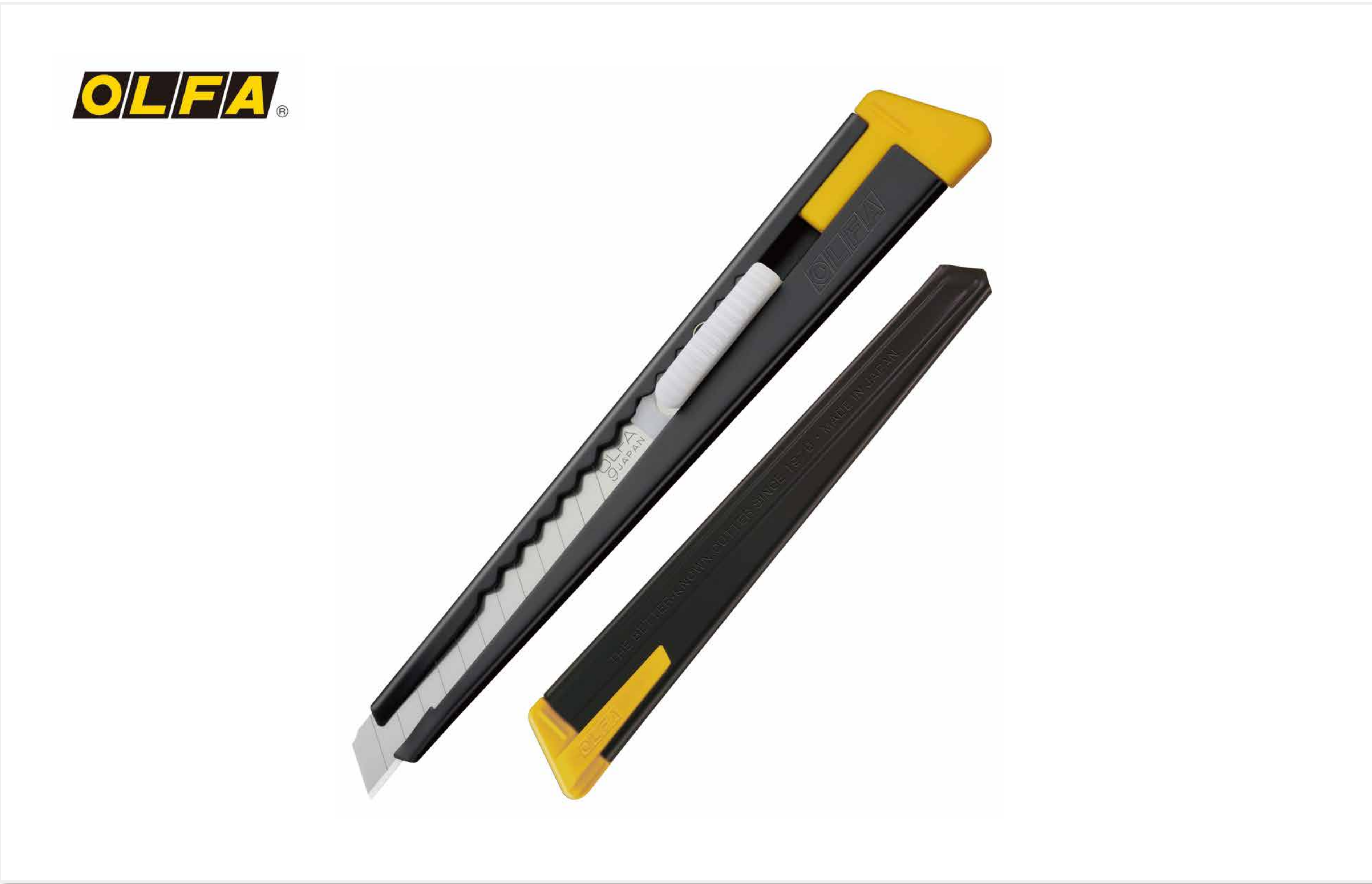
カッターナイフ ブラック S 型 (1970) 岡田 良男 オルファ株式会社