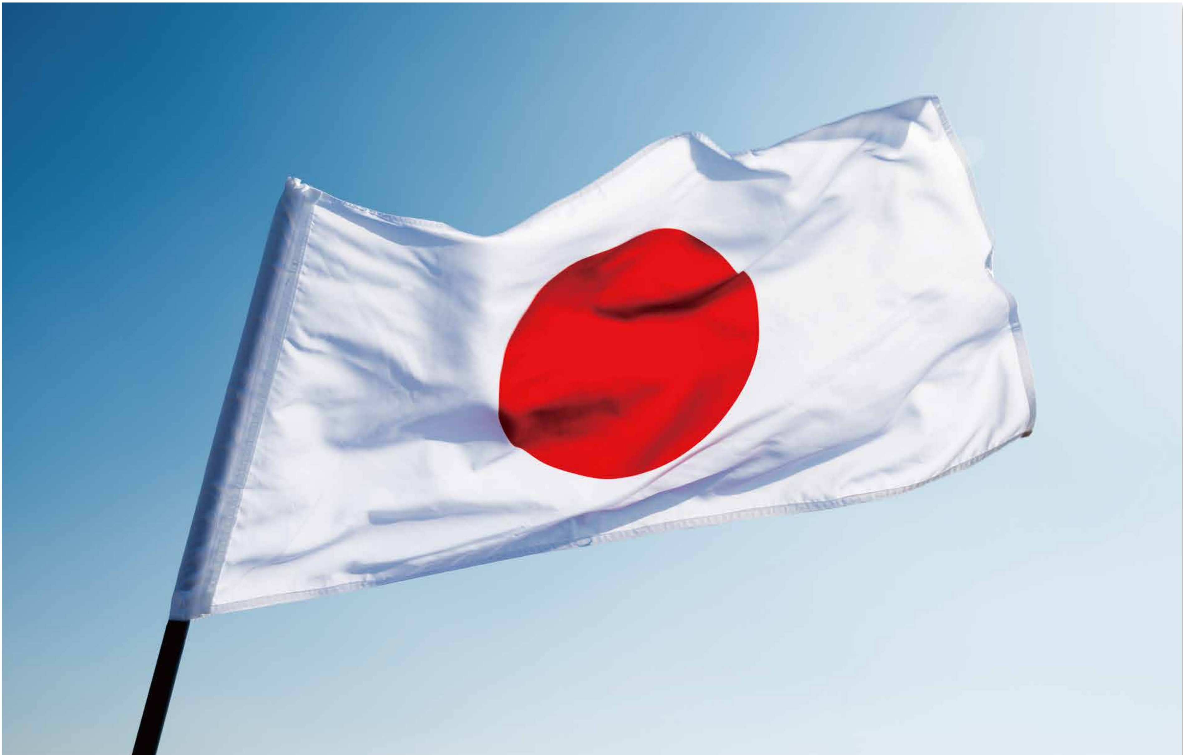
日本の国旗（不明）