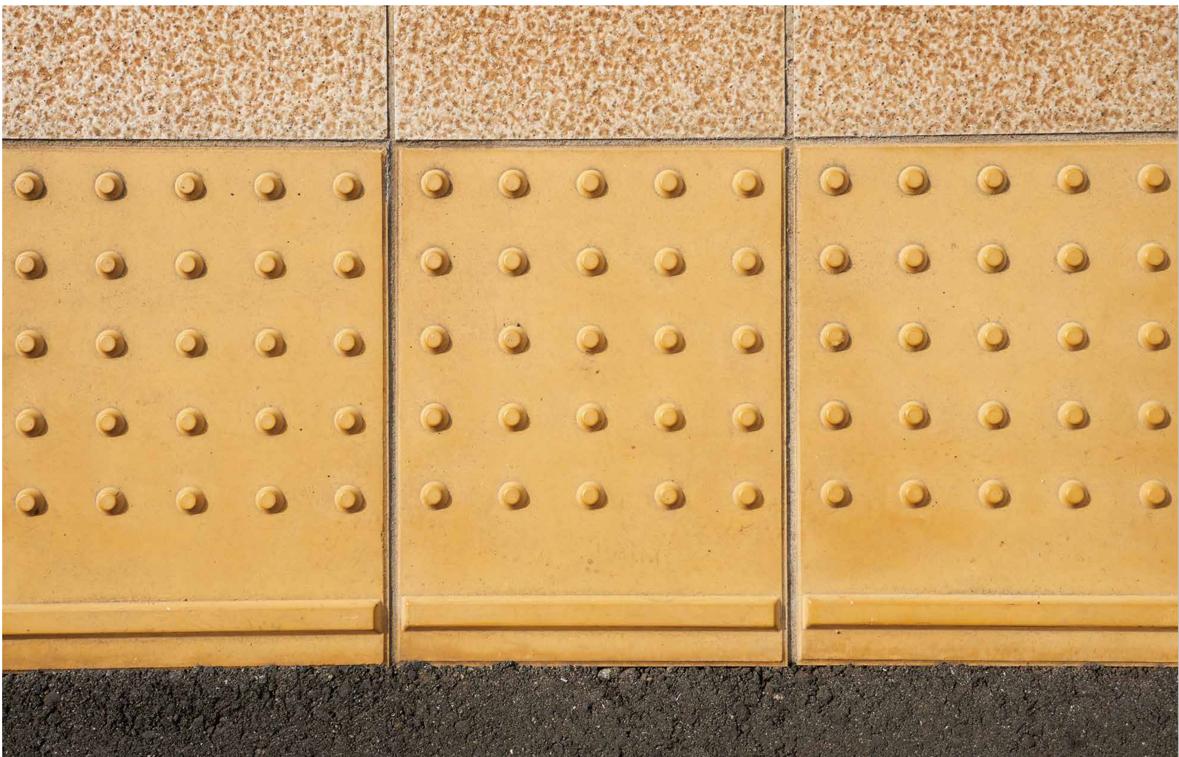
点字ブロック (1967) 三宅 精一