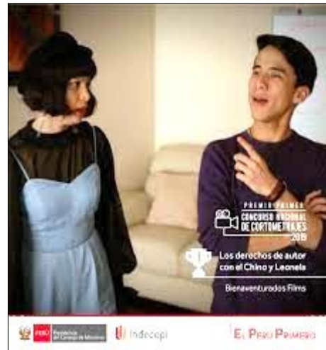
Победитель конкурса короткометражного кино: Los derechos de autor con El Chino y Leonela .

29. Это был первый конкурс Департамента авторского права, номинальным спонсором которого выступило Министерство культуры (эта традиция сохранилась по сей день).