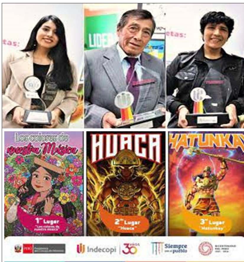
Победители, занявшие первые три места, и их работы