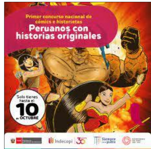
Посвященные конкурсу плакаты

31. Участники должны были представить комикс, включающий как традиционные, так и современные элементы перуанской культуры: доколумбовой, традиционной или культуры коренных народов, с выражениями культуры (традиционными или современными) из любого региона страны.