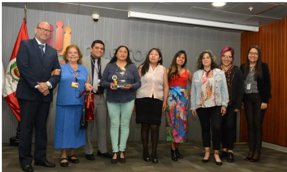
Победители конкурса позируют с судейской коллегией и сотрудниками Департамента авторского права в день церемонии награждения

20. Вдохновением послужила лликлла из Пуны; автор подчеркнула сочетание цветов и форму лликллы врезками разных элементов, использованием вязки крючком и изобразительного искусства в крашеной ткани. Лликлла – это тканый предмет одежды у женщин из Перуанских Анд, который можно использовать по-разному. Обычно это разноцветная ткань, узоры, рисунки, размер и цвета которой варьируются в зависимости от региона, этноса и национальности ремесленника.