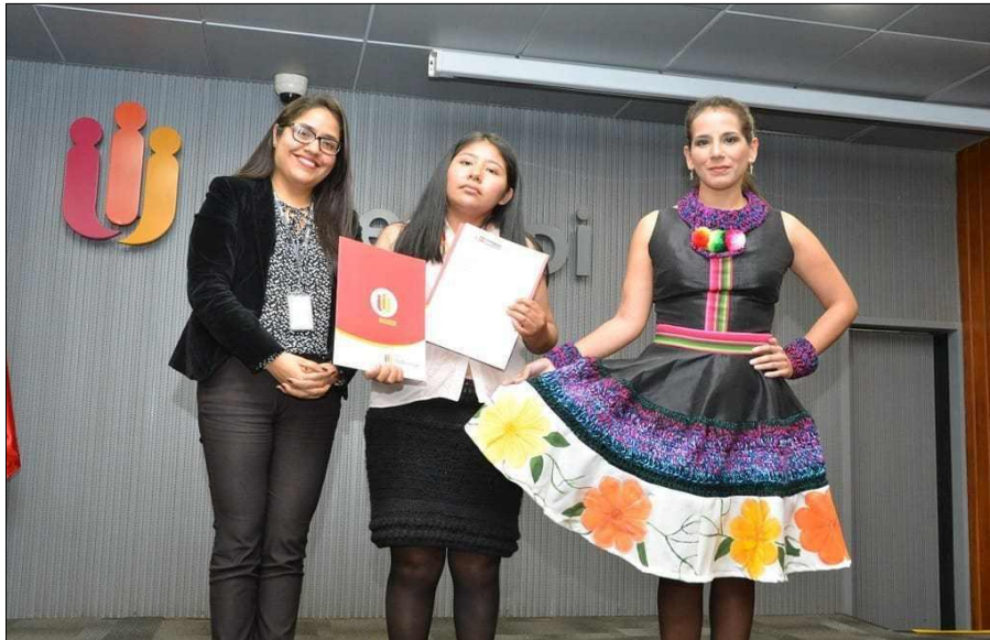
Третье место: одежда GLOSBE, что на языке аймара означает «разноцветный».

20. Вдохновением послужила лликлла из Пуны; автор подчеркнула сочетание цветов и форму лликллы врезками разных элементов, использованием вязки крючком и изобразительного искусства в крашеной ткани. Лликлла – это тканый предмет одежды у женщин из Перуанских Анд, который можно использовать по-разному. Обычно это разноцветная ткань, узоры, рисунки, размер и цвета которой варьируются в зависимости от региона, этноса и национальности ремесленника.