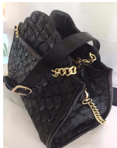
Второе место: аксессуар Selva Cautivante (сумка).