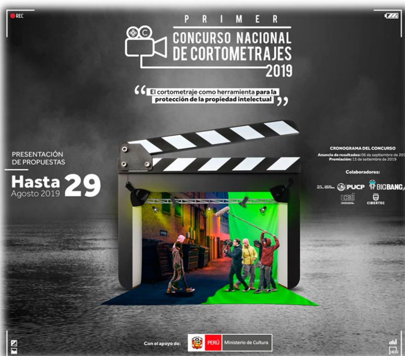
Посвященный конкурсу плакат

26. В 2019 году Департамент авторского права провел первый конкурс короткометражного кино с целью донести информацию о важности авторского права до представителей аудиовизуального сектора и создать произведения, направленные на переоценку национального самосознания и культуры Перу и повышение осведомленности для укрепления уважения к ИС.