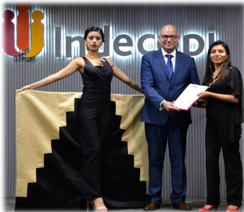
Второе место: двустороннее платье Тава.