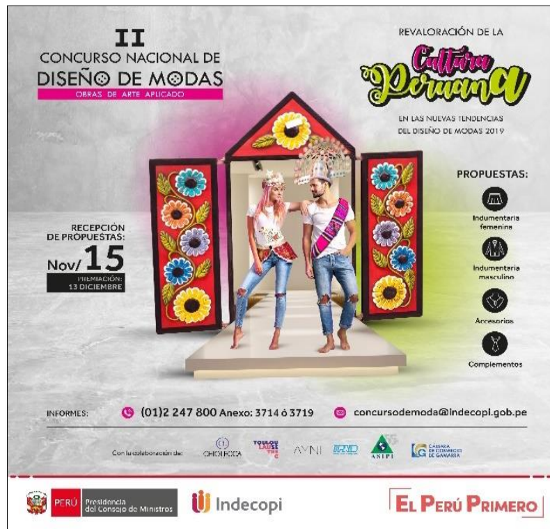
Посвященный конкурсу плакат

21. Успех и популярность первого конкурса дизайна одежды для произведений прикладного искусства побудили Департамент авторского права провести его во второй раз в 2019 году.