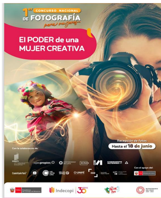
Посвященные конкурсу плакаты