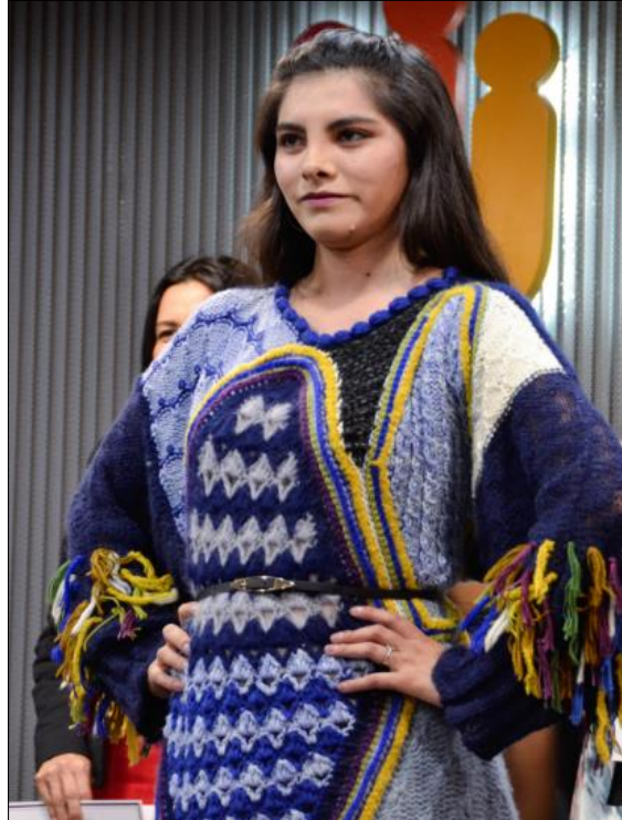
Первое место на конкурсе: платье Lareñas.